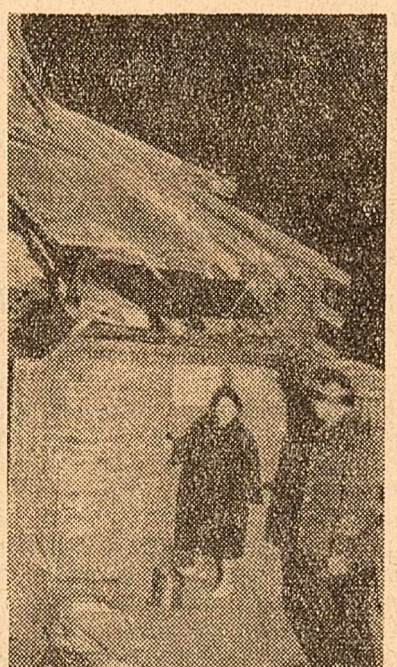
Ravagiu uraganului Frieda în orașul Hanovera (R. F. Germană)