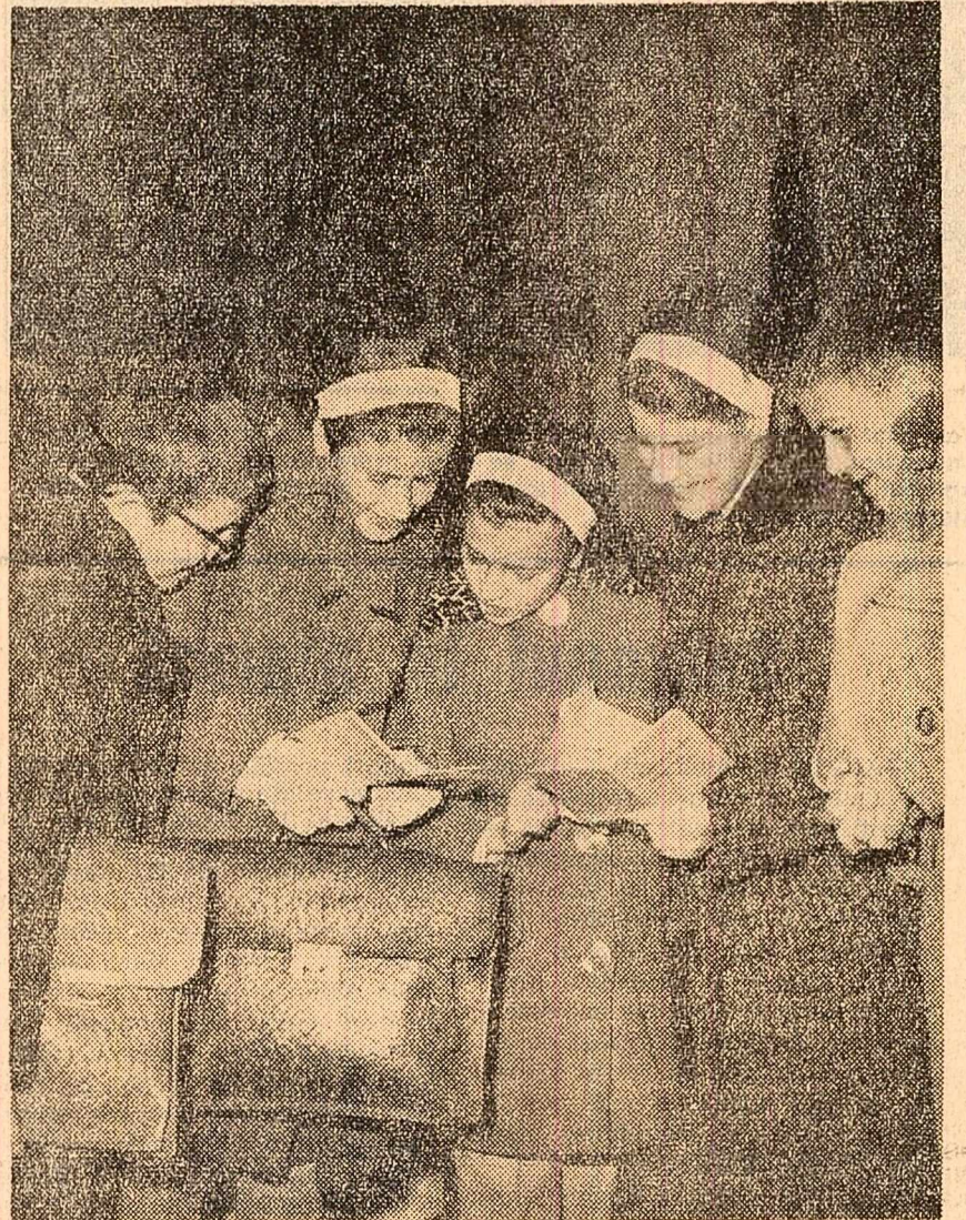
Preludiu la vacanță: Notele 1