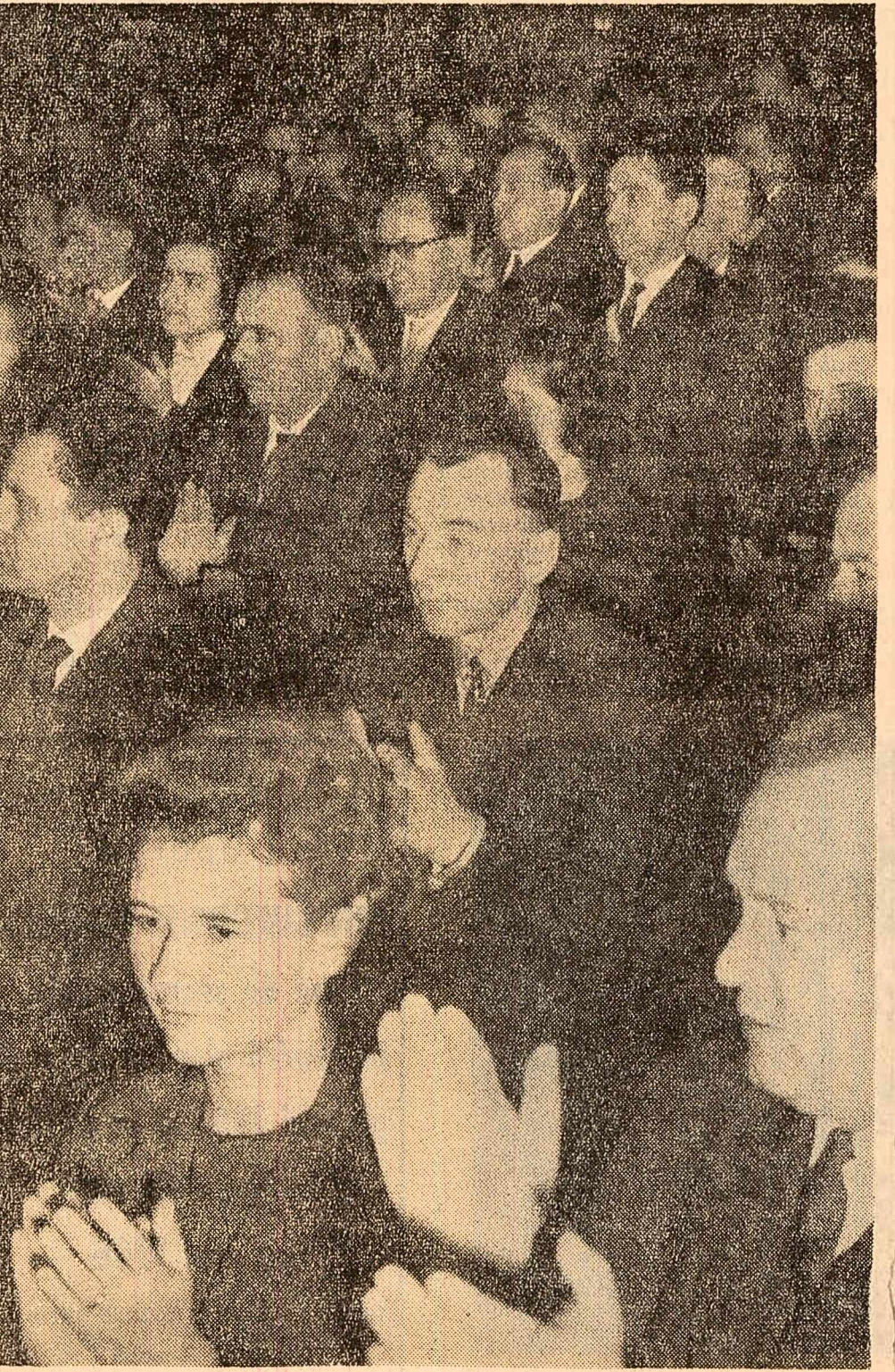
În timpul lucrărilor sesiunii

(Expunerea a fost subliniată cu vil aplauze).