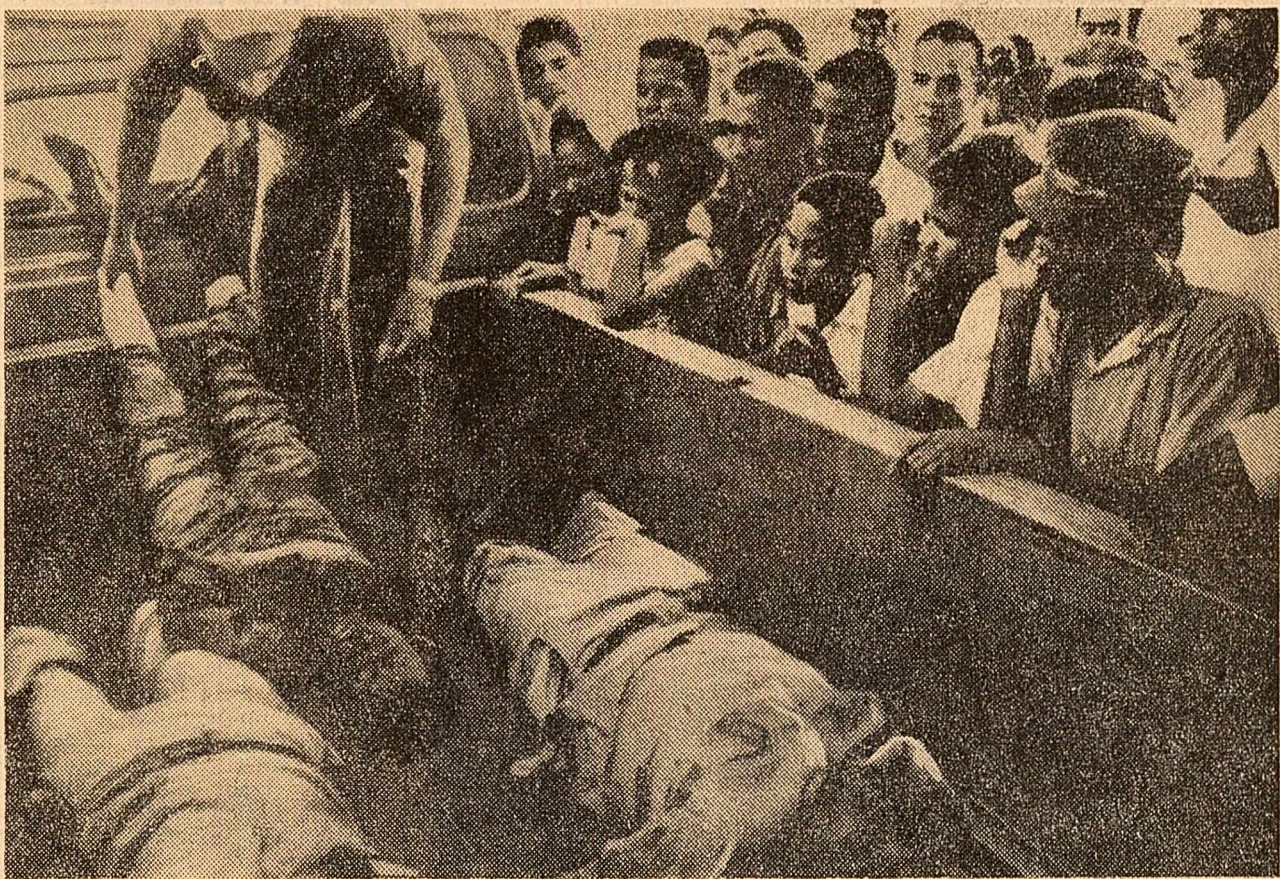
În orașul dominican Santiago au avut loc duminică grave incidente provocate de trupele guvernamentale, care au supus unui adevărat asediu căldura în care se aflau reprezentanții ai forșului guvern constituționalist. S-au înregistrat 28 de morți și numeroși răniți. Toate acestea se întîmplă sub oblađuirea așă-ziselor forțe interamericane de pace