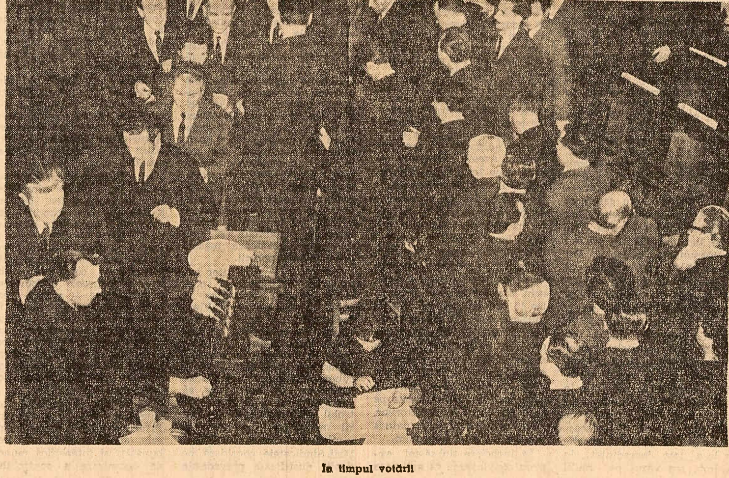
În timpul votării

Art. 21. - Normele republicane și departamentale de protecție a muncii existente la data publicării prezentei legi rămîn în vigoare pînă la emiterea altor norme. Art. 22. - Încălcarea dispozițiilor legale privitoare la protecția muncii atrage răspunderea disciplinară, administrativă, materială sau penală, după caz, potrivit legii.