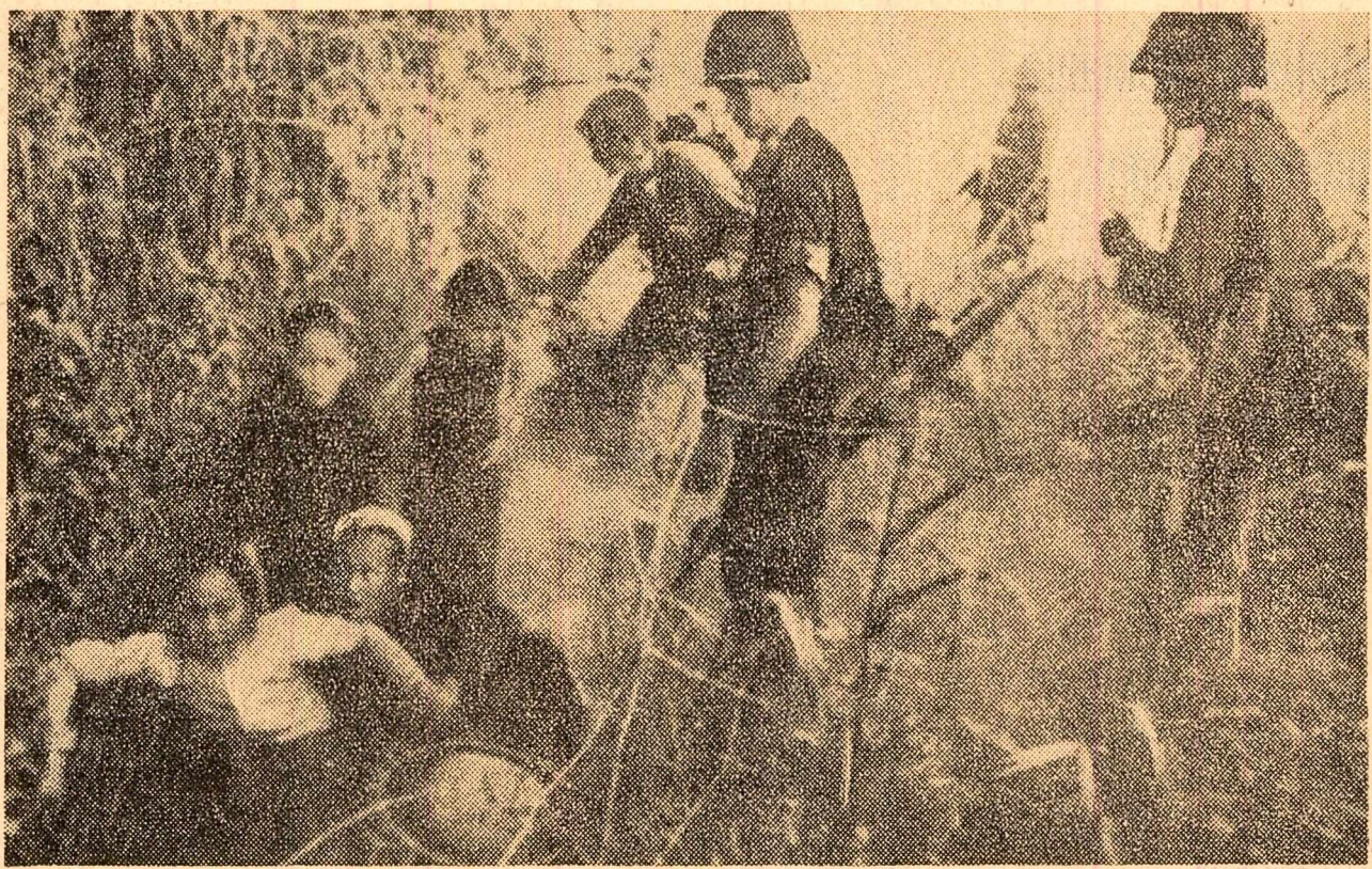
În drum spre țară DELEGAȚIA GUVERNAMENTALĂ ROMÂNĂ A TRECUT PRIN BUDAPESTA