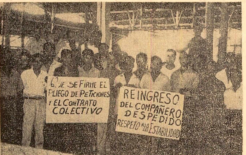
Muncitorii grevești de la fabrica „Jaboneria Nacional” din orașul Guayaquil (Ecuador) au ocupat scările întreprinderii cerînd îmbunătățirea condițiilor de muncă

Între timp s-a aflat că garnizoana militară din Guayaquil, cel mai mare oraș industrial din țară, a fost întărită cu două batalioane și unități blindate. Postul președinte al Ecuadorului, Camilo Fonce Enriquez, a declarat în cadrul unui program televizat că dacă junta militară „nu va adopta măsuri pentru a asigura înapoierea la un regim constituțional”, țara „se va îndrepta inevitabil spre un război civil”.