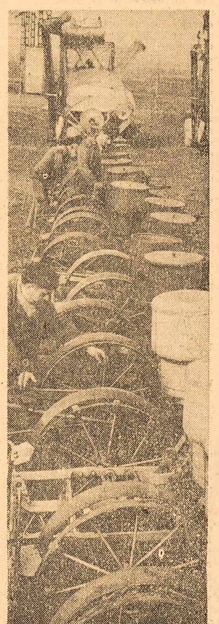
Pregătiri pentru campania agricolă de primăvară la S.M.T. Chitila-București

A răspuns acad. Ștefan Nicolau.