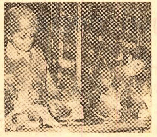
Destinatarele sint in asteptare. (La „Romaria” se pregatesc pachete pentru „Decada cadourilor”)