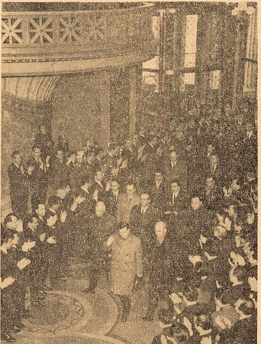
Participanții la consfătuire salută cu însușire sosirea conducătorilor de partid și de stat