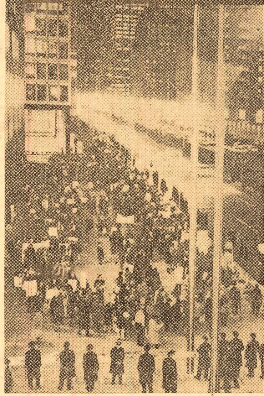
La intrarea hotelului „Waldorf Astoria” din New York — baraj de poliști. De-a lungul bulevardului o mare mulțime — 7000 de demonstranți — l-a întâmpinat miercuri seara pe președintele Johnson la hotel unde a participat la o festivitate.