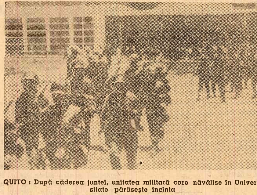
QUITO: După căderea juntei, unitatea militară care năvălise în Universitate părăsește incinta

Misiunea de legătură a înaltului comandament al Armatei populare vietnameze a trimis un mesaj Comisiei internaționale de supraveghere și control în Vietnam, în care protestează energic împotriva violării teritoriului R. D. Vietnam la 29 martie, de către numeroase formațiuni de avioane de luptă americane, care au mitraliat și bombardat centre populate și obiective economice din provincia Quang Binh.