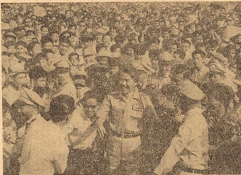
În obiectivul reporterilor: demonstrație la Hue împotriva regimului de la Saigon. În centru — generalul Thi, care a trecut în opoziție față de guvernul sud-vietnamez

Presă braziliană consideră că eșecul recentei conferințe din Panama a Organizației Statelor Americane se datorează „politicii intransigente” a S.U.A. Ziarul arată că de la ultima conferință a acestei organizații (noiembrie 1965), eșecul S.U.A. a devenit și mai negativă față de revendicările economice ale statelor sud-americane. Cerința acestora a fost, în primul rînd, de a se asigura prețuri stabile și echilabile pentru materiile prime și produsele agricole pe care statele latino-americane le exportă îndeobște. De asemenea — cum remarcă ziarul vest-german „Frankfurter Allgemeine” — țările respective au cerut ca S.U.A. să se angajeze să nu mai vindă surplusurile agricole pe piețele mondiale pentru a nu face concurență statelor latino-americane în emisfera epuseană. Reprezentanții S.U.A. au refuzat să recunoască justetea acestor revendicări, ceea ce a sfîrșit noi nemulțumiri în rândurile partenerilor lor din O.S.A.