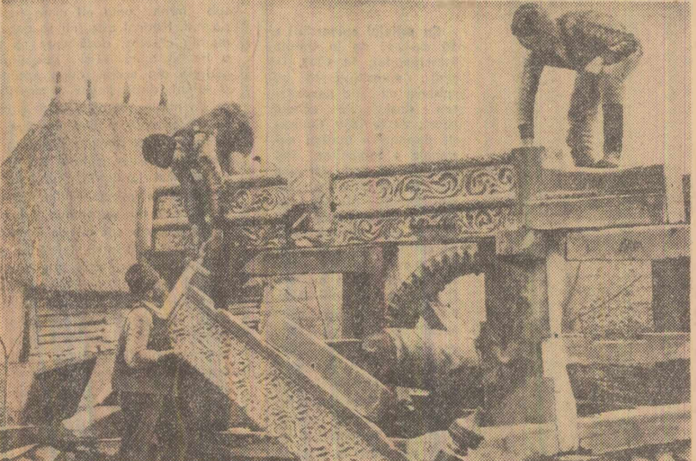
O nouă piesă a Muzeului etnografic al Transilvaniei din Cluj: moară datînd din 1819 din Josenil Birgăului. Decorațiile exterioare, cu care este împodobită moara, sînt de o rară frumusețe. În fotografie: se lucrează la montarea morii