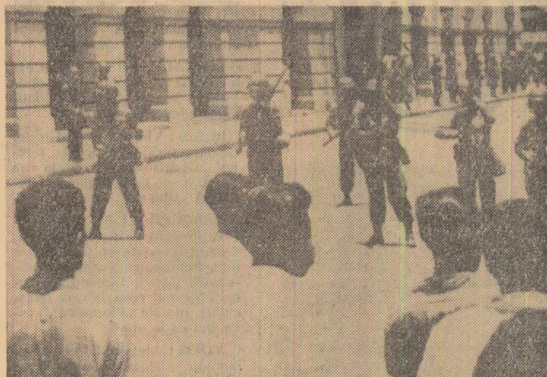
Două imagini din Ecuador după căderea juntei militare: Sus — la Quito, unități militare în jurul palatului guvernamental; jos — o mulțime entuziasată sărbătorește pe străzile Guayaquilului înzornirea militarilor de la putere. S-a anunțat că o serie de funcții, deținute pînă acum de militari, au fost preluate de persoane civile

ULAN BATOR 2 (Agerpres). — La 1 aprilie a avut loc semnarea Planului de colaborare culturală între Republica Socialistă Română și Republica Populară Mongolă pe anul 1966—1967. Planul a fost semnat, din partea română, de către Petre Niță, ambasador extraordinar și plenipotențiar al Republicii Socialiste România în Republica Populară Mongolă, iar din partea mongolă de către S. Sosorbaram, prim-adjunct al ministrului afacerilor externe al Republicii Populare Mongole. La semnare au participat E. Dorjsuren, adjunct al ministrului culturii, și alte persoane oficiale.