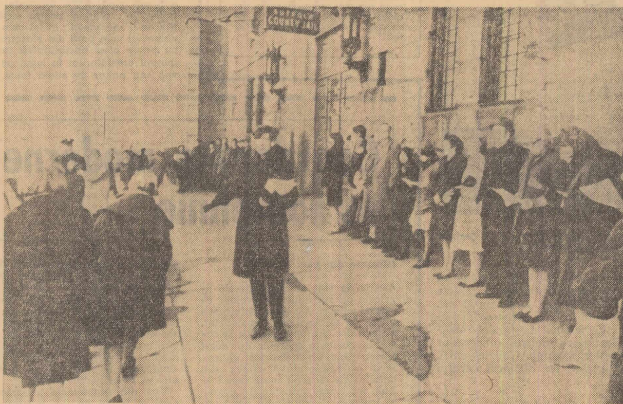
În fața închisorii din Boston au început vineri demonstrații de solidaritate cu tinerii condamnați pe timp de 30 de zile pentru că au participat la o manifestație împotriva agresiunilor americane în Vietnam. Aceste manifestații vor continua în fiecare zi, pînă la expirarea termenului de întemnițare

În cercurile comunitare din Bruxelles se manifestă pesimism față de soluționarea acestor probleme, scria ziarul francez „Le Figaro”, relevind că „Fanfani (ministrul de externe Italian — n.r.) nu va veni la acest Consiliu ministerial, deoarece consideră imposibilă realizarea unui acord săptămîna viitoare.”