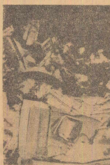
Un avion cvadrimotor de tipul „Electra”, aparținînd companiei „American Flyers”, avînd la bord 32 de militari, s-a prăbușit vineri seara în munți, în apropierea localității Ardmore (Oklahoma). Potrivit ultimelor informații, 18 persoane au supraviețuit catastrofei.

Peședintele S.U.A. a refuzat, pe de altă parte, să comenteze nota remisă de guvernul francez cu privire la N.A.T.O., afirmînd că guvernul american procedea la o examinare a problemelor legate de retragerea Franței din organismele integrate ale N.A.T.O.