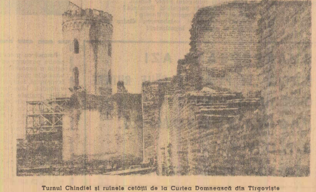
Turnul Chindiei și ruinele cetății de la Curtea Domnească din Tîrgoviște