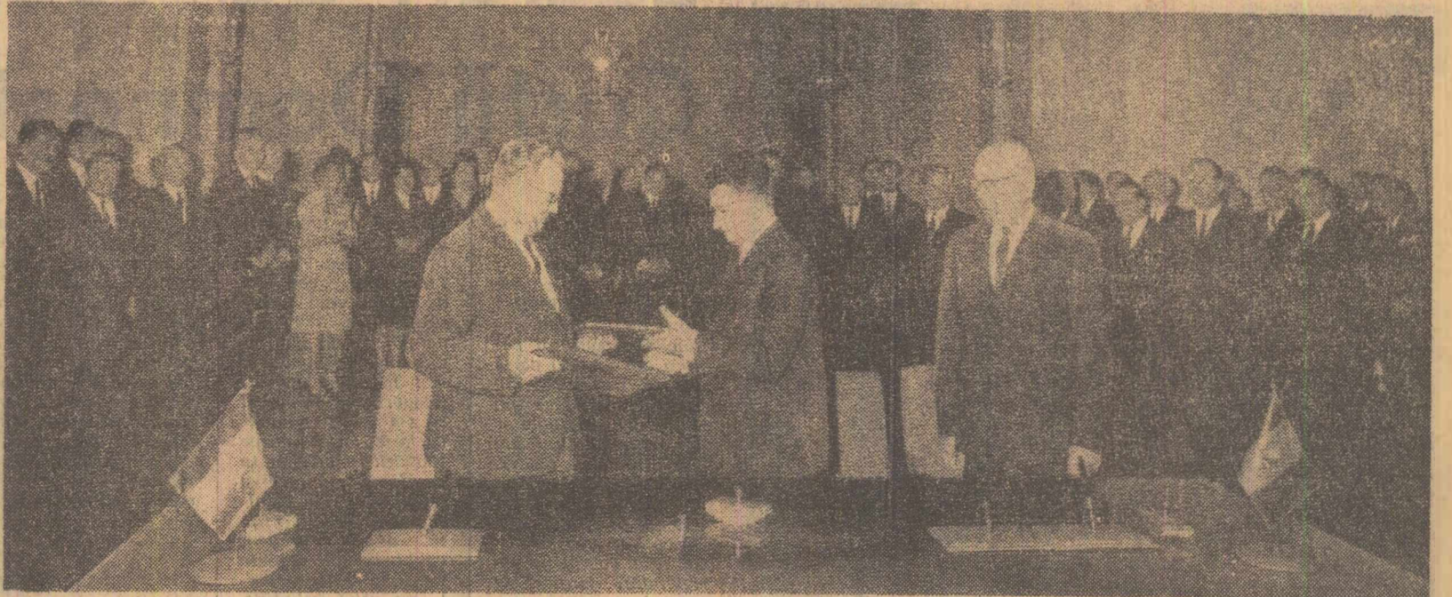
După semnarea comunicatului comun