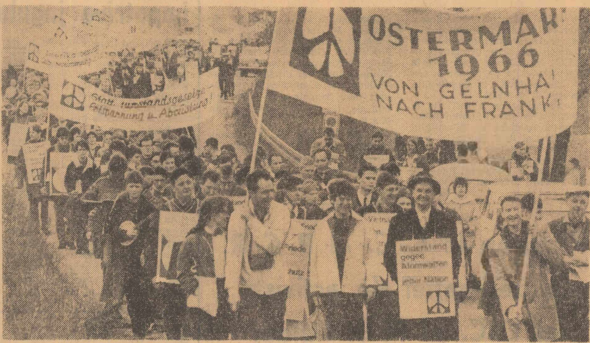
Pe străzile orașului Hanau (R.F.G.), inundate de participanți la tradiționalul marș de primăvară împotriva încălzirii atomice

Vineri s-a născut în Franța un nou grup industrial de talie internațională: cele două mari vechi firme constructoare de automobile „Renault” și „Peugeot” au încheiat un acord de asociere.