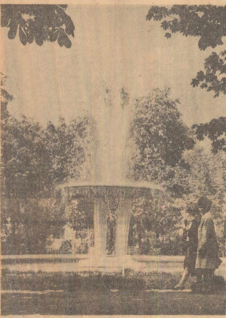
Instantaneu bucureștean. Pe dulevardul Republicii din Capitală