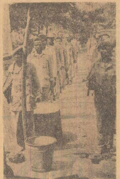
Forțele patriotice din Angola au aniversat cinci ani de la declanșarea luptei pentru eliberare națională, prin noi atacuri intense împotriva trupelor coloniale ale Portugaliei. Fotografii înfățișează un grup de luptători patrioți la baza din Cabinda

La Brescia, muncitorii au ocupat în mod simbolic întreprinderile „S.M.I.” iar la Venetia, Bergamo și Regio Emilia au fost organizate demonstrații la care au participat mii de oameni ai muncii. Acțiuni de mare amploare au avut loc la Genova, unde muncitorii metalurgiști au străbătut întregul oraș revendicînd încheierea noilor contracte de muncă, suspendarea concedierilor și a represaliilor din partea patronilor.