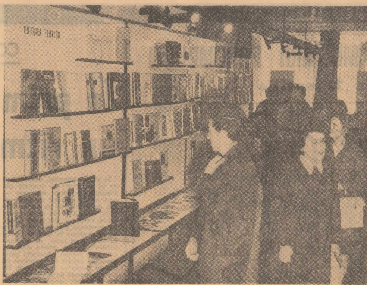
La casa de cultură a I.R.R.C.S. s-a deschis simbolic la amiază expoziția „Cele mai frumoase cărți ale anului 1965”, organizată de Centrul editurilor și difuzării cărții și Truștii industriei poligrafice. Sînt expuse 500 de lucrări din cele 2.500 de titluri apărute anul trecut, din toate domeniile de activitate: literatură politică și social-economică, beletristică, științifică și tehnică, pentru copii, artă, manuale pentru învățămîntul de toate gradele, literatură de informare și popularizare. La vernisajul expoziției a luat cuvîntul, în prezența a numeroși lucrători din editură, Al. Balaci, vicepreședinte al Comitetului de Stat pentru Cultură și Artă. Expoziția este deschisă pînă la 8 mai în sala din str. Mihail Eminescu nr. 8. În fotografie: Aspect din sala expoziției. (Agerpres)

O problemă de metodă a predării este și delimitarea cunoștințelor noi apărute, la care elevii urmează să aibă acces. Spun această deoarece aproape mereu cînd se face o nouă descoperire sau o aplicație a ei, este socotită ca avînd o importanță extraordinară. Cîteodată chiar are. De cele mai multe ori însă, lucrurile rămîn circumscrie la un domeniu limitat și particular. Pe vremea cînd eram studenți, apăruse așa-numitul PH, referitor la concentrarea ionilor de hidrogen. În laboratoare se lucra la PH, medicii explicau bolile cu ajutorul PH; astfel, domeniul de aplicabilitate e mai restrîns decît se credea la început. Același destin l-au avut și alte descoperiri, ceea ce credem, pledează pentru ca programele de învățămînt să fie alcătuite pe o perioadă mai lungă de timp, chiar dacă în domeniul disciplinelor respective apar mereu alți și alte lucruri noi. Esențial în această problemă, ca și în altele de același fel, mi se pare a fi nu atât cantitatea de cunoștințe introduse în lecții, ci modul în care ele sînt înfățișate, perspectiva dobîndită în explicarea lor, linia continuității trasată de profesor între aspectele mai vechi și mai noi din care se compune un domeniu științific.