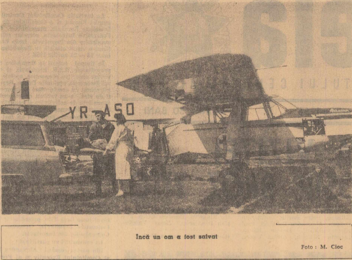
Încă un om a fost salvat

Desigur că activitatea intensă de construcții din cadrul circulației va îmbunătăți esențial aspectul unor căi de circulație atât prin realizarea noilor unități de locuit și a dotărilor aferente, cât și prin lucrări de specialitate rutiere. Noi rocade, pasaje vor dizolva strînguliturile; trasee moderne vor descongesciona circulația și vor schimba în mai bine aspectul orașelor. Dar considerăm necesar să se ia încă de acum o serie de măsuri gospodărești privind micile amenajări și rețelări, care fără investiții mari pot infumuseja străzile și șoselele, contribuind direct la îmbunătățirea condițiilor de securitate și confort ale circulației. În ce ne privește, în arhitectură și în artă, trebuie să acordăm o atenție sporită problemelor de estetică și funcționalitate legate de transportul în cadrul dezvoltării orașelor noastre socialiste.