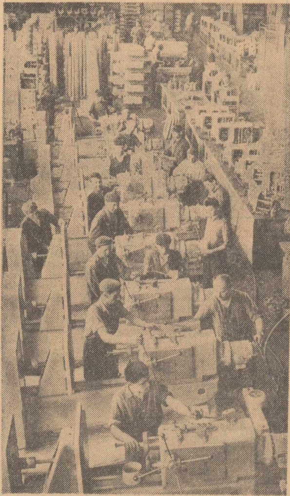
Linia de montaj a mașinilor de găurit de la uzina „Înfrățirea”-Oradea

Consfătuirea pe țară a lucrătorilor din industria construcțiilor de mașini va prilejui un schimb larg de opinii în scopul îmbunătățirii — în toate compartimentele și la toate nivelurile — a activității din această ramură hotărâtoare a economiei naționale. Neîndoiește, recomandările și măsurile pe care le va preconiza consfătuirea vor contribui la dezvoltarea inițiativă, la stimularea spiritului creator al tuturor lucrătorilor din industria construcțiilor de mașini. Consfătuirea va constitui un puternic imbold în munca lor închinată îndeplinirii sarcinilor de mare răspundere ce le revin în actualul cincinal, desăvîrșirii construcției socialiste în patria noastră.