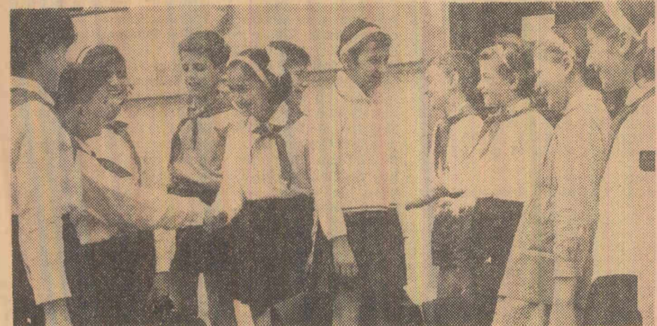
După ultima oră de curs (Sîmbătă 28 mai elevii claselor I-IV au intrat în vacanța de vară).