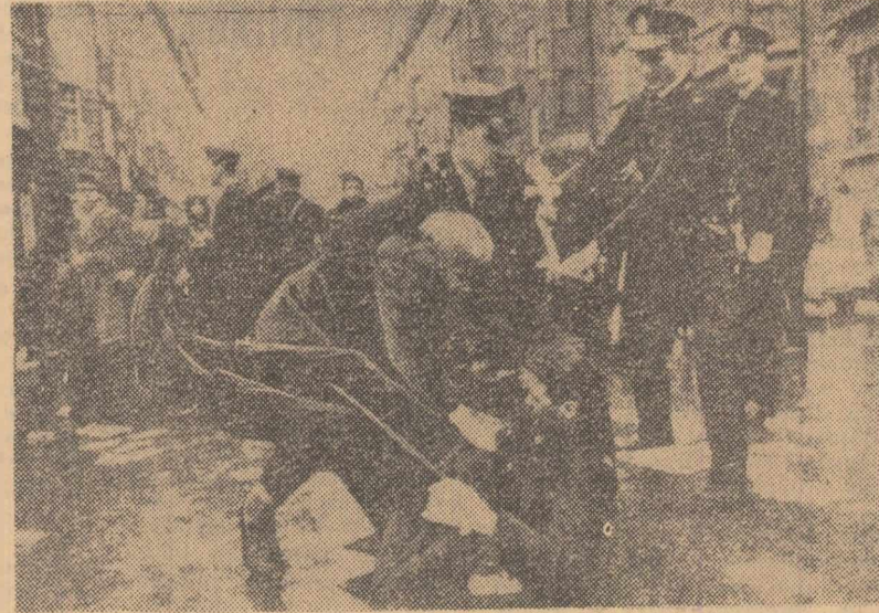
Stockholm. Simbătă după-amiază la Stockholm a avut loc o demonstrație în cadrul căreia numeroși studenți au condamnat războiul dus de Statele Unite în Vietnam. După cum informează agenția Associated Press, poliția a intervenit împotriva demonstrațiilor.

Pe plan militar, principalele acțiuni semnalate duminică au fost bombardarea de către patrioții vietnamezi, cu mortiere și tunuri, a aerodromului Vinh Long, situat la 100 km sud-vest de Saigon în delta Mecongului, unde un număr de elicoptere americane au fost avariate, și luptele ce au avut loc între forțe patriotice și elemente ale diviziei a 25-a de infanterie americană la 40 km vest de Pleiku, în apropierea frontierei cu Cambodgia.