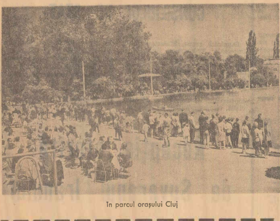
În parcul orașului Cluj