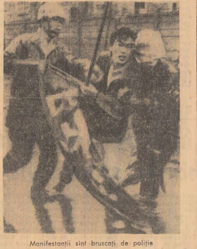
Manifestanții sînt bruscați de poliție

Tot luni, la Tokio a avut loc o ședință extraordinară a conducerei Partidului Socialist din Japonia, care a aprobat declarația de protest împotriva staționării submarinelor atomice americane în porturile japoneze arătînd că „vizita” submarinului „Snook” reprezintă un real pericol pentru securitatea Japoniei.