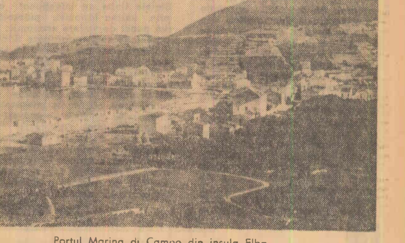
Portul Marina di Campo din insula Elba