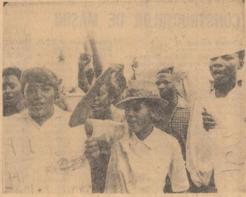
Dar-Es-Salaam (Tanzania). Refugații rhodesieni demonstrează împotriva regimului rasist al lui Ian Smith