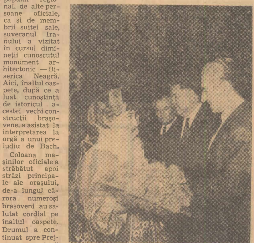
Primirea la Prejmer

și-a exprimat dorința de a cu-noaște îndeaproape fermele sec-torului zootehnic. „Ne interesează foarte mult ce ați realizat dv., deoarece avem intenția de a or-ganiza în Iran o fermă de acest gen pe 4.000 de hectare” — a sub-liniat înaltul oaspete. Au fost a-rătate „recordmenele” fermei, fie-care vacă de rasă de aici dînd în jurul a 45 litri de lapte pe zi. S-a mers apoi la păstrăvăria gospo-