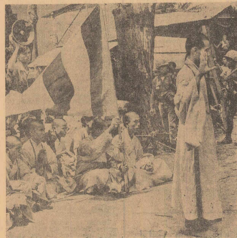
Da Nang. Proei budisti barează calea tancurilor, cerind demisia guvernului Ky

neapă de institutul budist și semnat de un comitet creat ad-hoc și denumit „Mișcarea de luptă pentru salvarea poporului”.