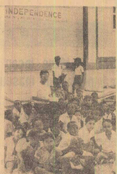
După acordarea independenței, la o școală din Guyana, copii învață noul limbaj național

VARSOVIA. În munții Tatras și în munții Invecinați ninge în continuu din dimineața zilei de 29 mai. Luni la Zakopane s-a înregistrat un ger de —5 grade, iar grosimea zăpezii a atins 23 cm. În împrejurimile localității Zakopane circulația auto s-a întrerupt, nămeții de zăpadă au izolat bazele turistice, firele telefonice s-au rupt sub greutatea zăpezii.