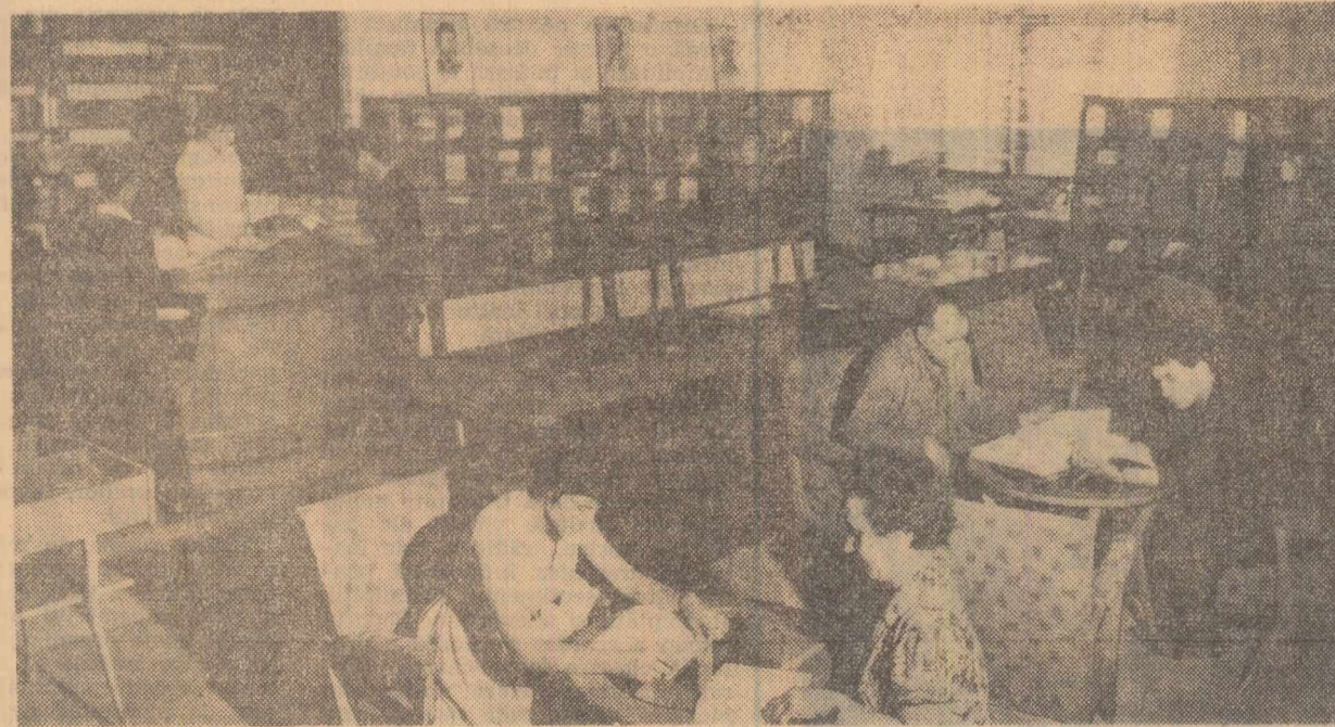
Clubul Sindicatului uzinei de utaj greu „Progresul” din Brăila

Analizând situația învățământului superior în care este adecvată specializarea post-universitară, socotesc că forurile de învățământ ar fi în măsură să aducă unele îmbunătățiri rețelei universitare înțesând, unificând unele cadre sau grupe de speciali-