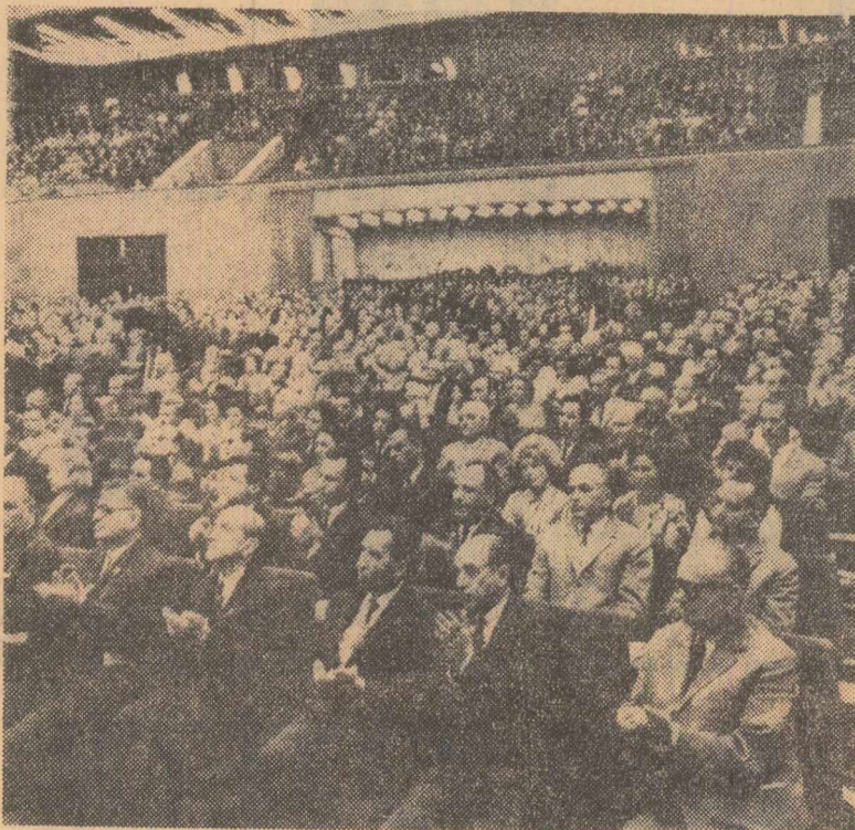
În timpul mitingului

În încheiere, vorbitorul a transmis oamenilor de știință, tuturor oamenilor muncii din China, un mesaj de prietenie, sincere urări de