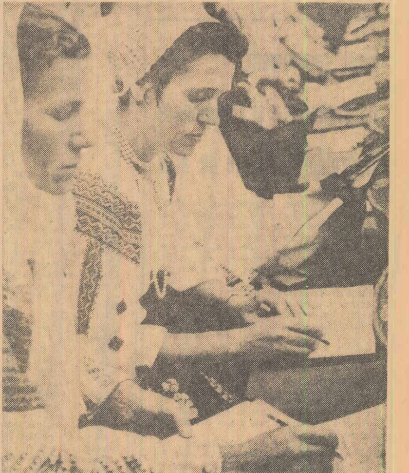
Aspect de la lucrările Conferinței

Seara, participantele la Conferință au asistat la un spectacol festiv prezentat pe scena Teatrului de vară din parcul de cultură și odihnă Herăstrău. (Agerpres)