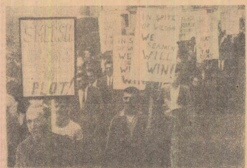
LONDRA. Demonstrație a marinarilor greviști

BUJUMBURA 23 (Agerpres). — În Burundi a fost descoperit miercuri un complot care viza răsturnarea guvernului și asasinarea actualilor conducători, a declarat ministrul de externe Marc Manirakiza. Se menționează că o parte din complotiștii au fost arestați.