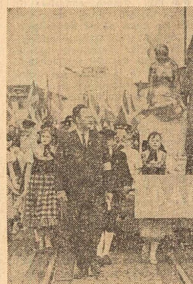
Intre 10 și 17 iulie s-au desfășurat la Rostock (R. D. Germană) ediția a noua a manifestărilor care au loc anual sub deviza „Marea Baltică, mare a păcii” și care au drept scop dezvoltarea legăturilor de bună vecinătate între statele europene din această regiune, indiferent de orientarea lor social-politică. În fotografie: Defilează delegația daneză

KÖLN 17 (Agerpres). — Organizația progresistă vest-germană „Asociația germană pentru pace” a organizat la Köln un forum internațional pe tema „Cum să asigurăm pacea și securitatea în Europa”. Au participat activiști pe tărîm social și oameni de știință din diferite țări europene. Cu toate că participanții și-au exprimat păreri diferite despre căile concrete de asigurare a unei păci trainice în Europa, toți au fost de acord că situația schimbată de pe continentul european pune tot mai acut pe ordinea de zi problema creării unui sistem european de securitate.