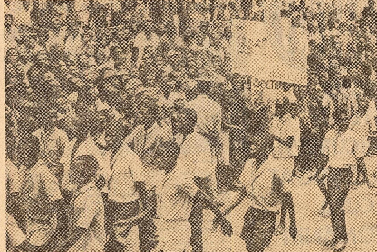
Puternică demonstrație antiimperialistă în capitala statului Congo (Brazzaville). Pe pancarta purtată de demonstrații se poate citi „Jos imperialismul”