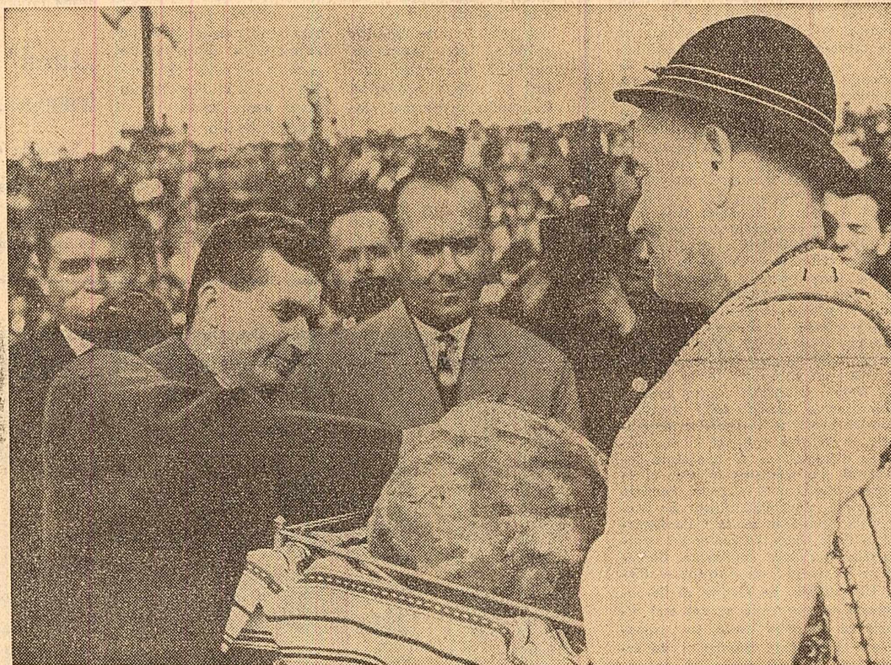
Un călduros „bun venit”

În curînd vales se deschide larg, la orizont profilîndu-se silueta unor coșuri fumegînde. Ele vestesc de departe orașul Tirnăveni, veche așezare medievală, devenită astăzi o puternică cetate a chimiei. Încă de la intrarea în oraș primirea căldă, entuziasată, făcută de zecile de mii de locuitori marchează drumul pînă la combinatul chimic. Aici conducătorii de partid și de stat sint întâmpinați de tov. Constantin Scarlat, ministrul industriei chimice, de cadrele de conducere ale combinatului și de un mare număr de muncitori, tehnicieni și ingineri.