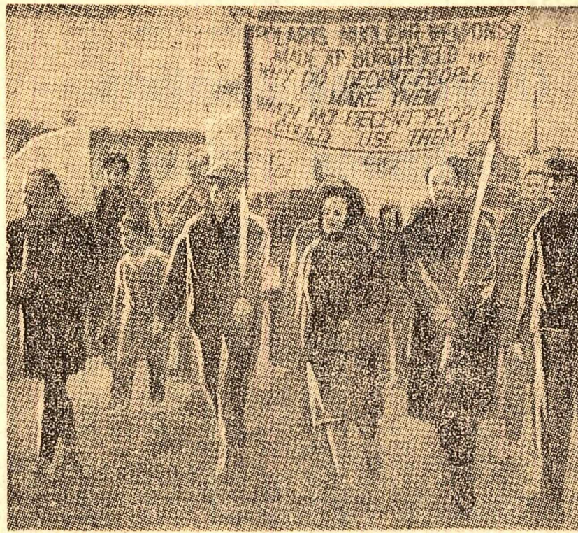
„Reduceți cheltuielile militare, nu slujbele”. Cu această pancardă au demonstrat numeroși muncitori englezi la Burghfield

LONDRA 12 (Agerpres). — „Nu trebuie să neglijăm nici un efort pentru a intra în Piața comună”, a declarat noul ministru de externe al Marii Britanii, George Brown, într-un interviu televizat. El a adăugat însă că va avea grijă ca interesele Marii Britanii să fie respectate. Vorbind despre Vietnam, Brown a recunoscut existența unei „anumite indispoziții” în sinul partidului laburist în legătură cu această problemă. El a apărut însă politica guvernamentală. Deși a afirmat că alianța atlantică ar avea o „importanță hotărâtoare”, noul ministru de ex-