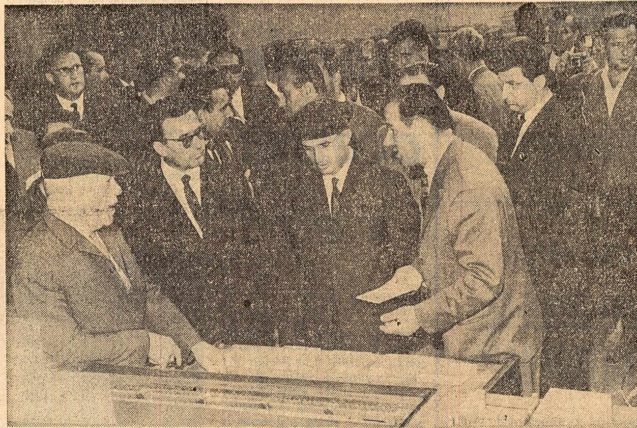
La Combinatul chimic Tirnăveni. Se analizează amplasarea noilor secții și fabrici prevăzute în cîncinul

Locuitorii orașului Mediaș și ai comunei Blăjei au făcut conducătorilor de partid și de stat o spontană și entuziastă manifestație de dragoste.