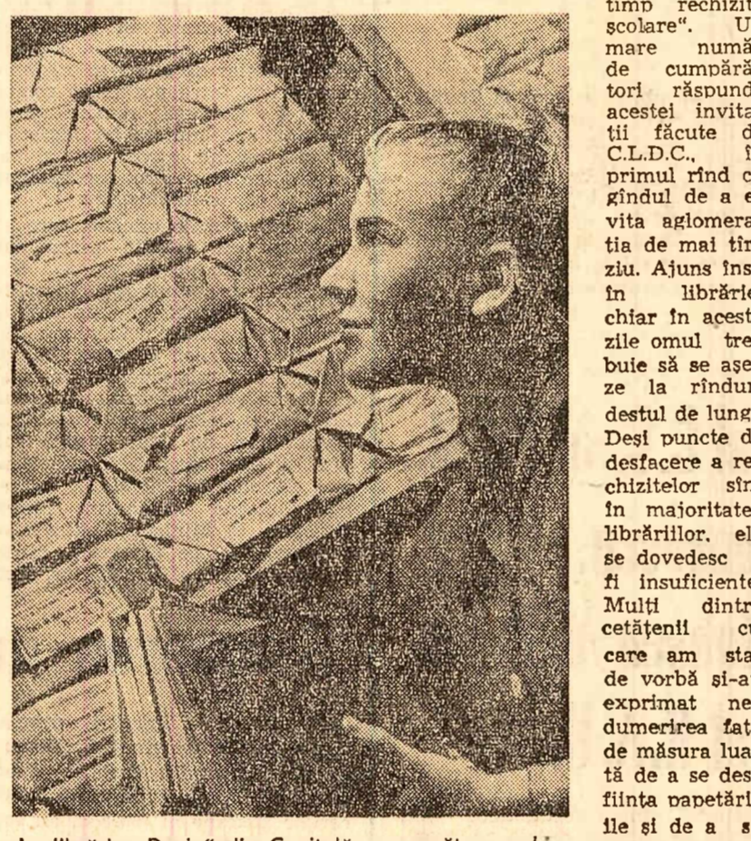
La librăria „Dacia” din Capitală se pregătesc rechizitele școlare.

în librării — acestor produse atât de solicitate. Observația e îndreptățită. În ultimii ani, fondul de marfă la papetărie a crescut cu peste 50 la sută, desfacerea la fondul pieței reprezentînd circa 2/3 din totalul vânzărilor. Totuși, proporția spațiului destinat rechizitelor a scăzut simțitor în ultimii trei ani. Așa s-a ajuns la situația prezentă, cînd spațiul afectat produselor de papetărie, la librăriile din perimetrul central al Capitalei, reprezintă cel mult o cincime din spațiul destinat celorlalte produse de librărie. Chiar și atunci cînd acestor „anexe” li s-a rezervat un spațiu separat de librăria propriuzisă (cazul librăriei „Mihail Eminescu” sau al celei de pe Str. Buzzești din Capitală) nu li s-a păstrat însă profilul; le-au mai fost repartizate spre vînzare: cărți turistice, ilustrate, care îngrăunază vînzarea rechizitelor școlare.