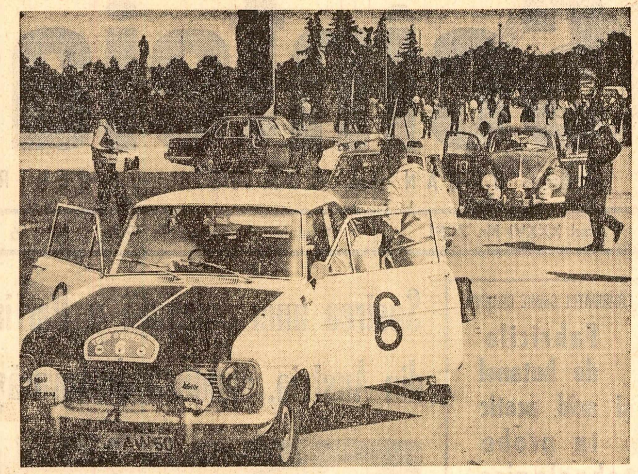
Ieri dimineață au sosit la București concurenții la cea de-a X-a ediție a competiției automobilistice „Turul Europei”. După o zi de odihnă, ei continuă azi dimineață drumul spre litoral.

programă pentru clasa I — se datorește întârzierilor în execuție și livrare din partea întreprinderii poligrafice „Banat” din Timișoara. Cine îngăduie asemenea neglijențe? Comitetele executive ale sfaturilor populare regionale vizate, ca și cel al Sfatului popular al orașului București au dator să analizeze situația îndeaproape și să ia măsuri pentru recuperarea rămănelor în urmă și aducerea „la zi” a livrărilor la absolut toate produsele.