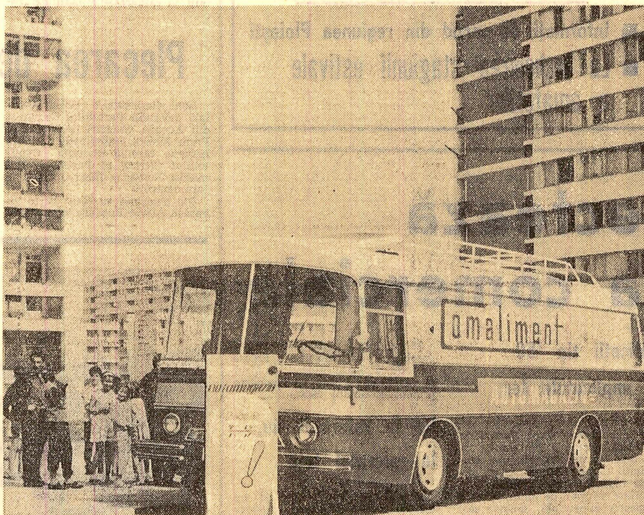
Automagazinul experimental al I.C.S. „Comilment” într-unul din noile cartiere ale Capitalei, unde încă n-au fost deschise complexe alimentare

triotică cu celelalte formații voluntare de pază contra incendiilor din țară. În activitatea de prevenire se cuvine să reliefăm ca un succes însemnat și faptul că în acest an, datorită măsurilor luate, în regiuni ca Dobrogea, București, Galați, Bacău și altele s-a reușit să se asigure stringerea recoltei de cereale fără pierderi provocate de incendii.