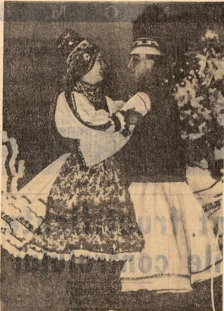
Dans din Maramureș