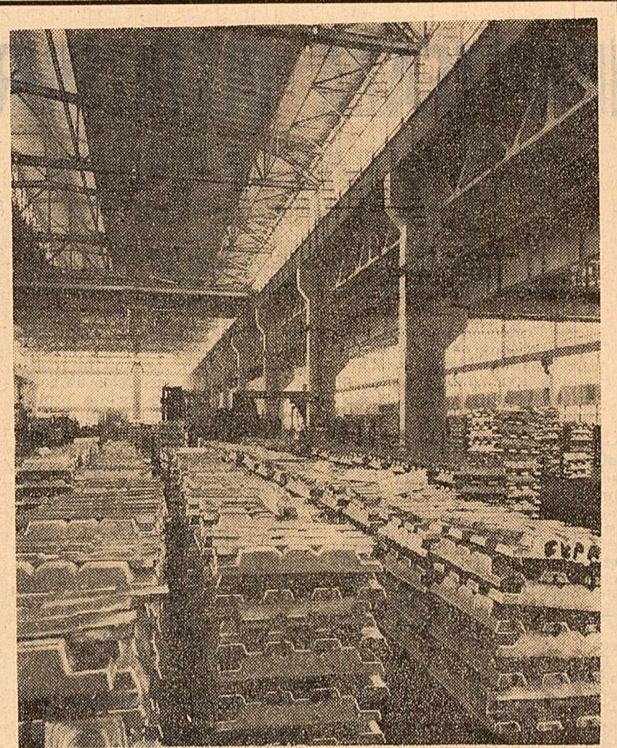
Lingouri de aluminiu, gata pentru expediere