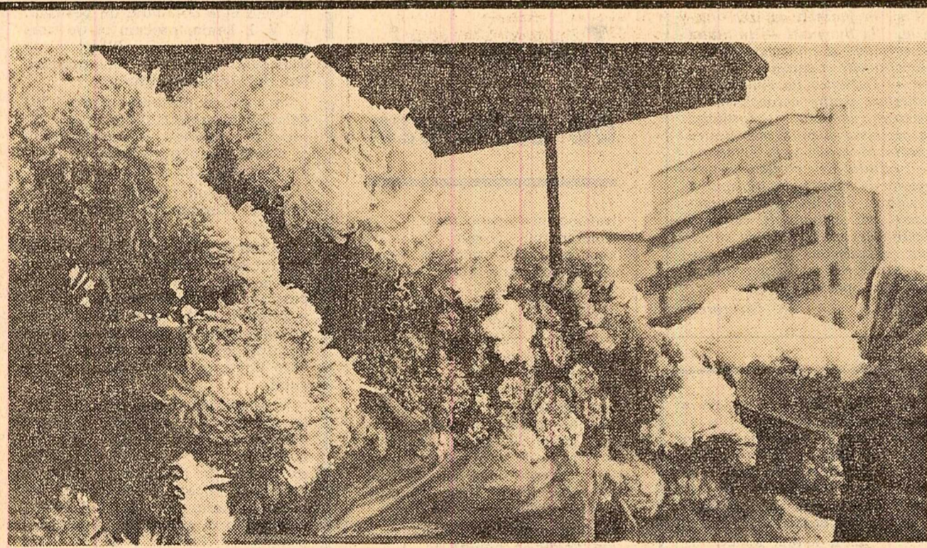
Flori de sezon