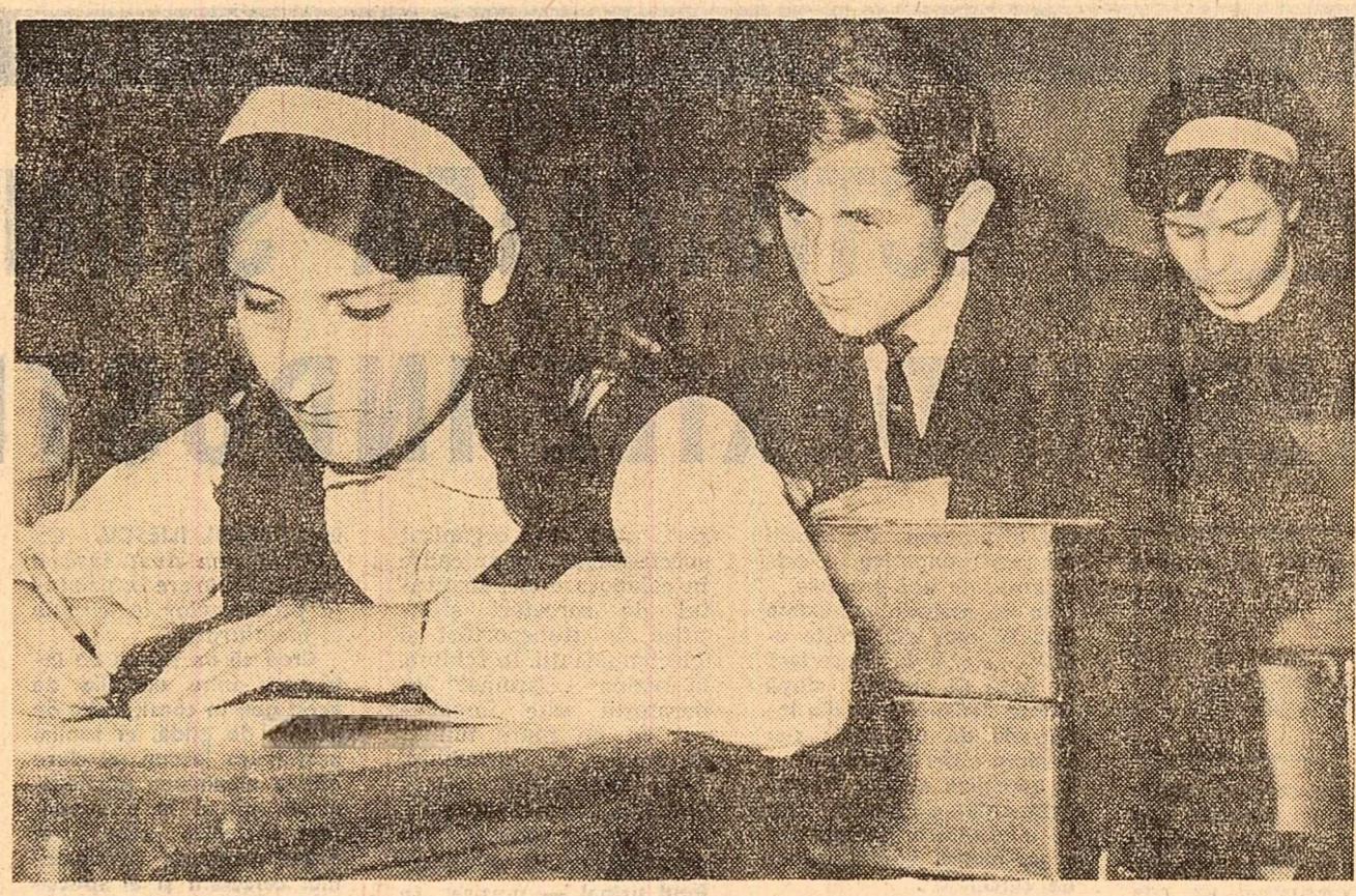
Liceul „Aurel Vlaicu” din Capitală. Au început tezele pe trimestrul I.