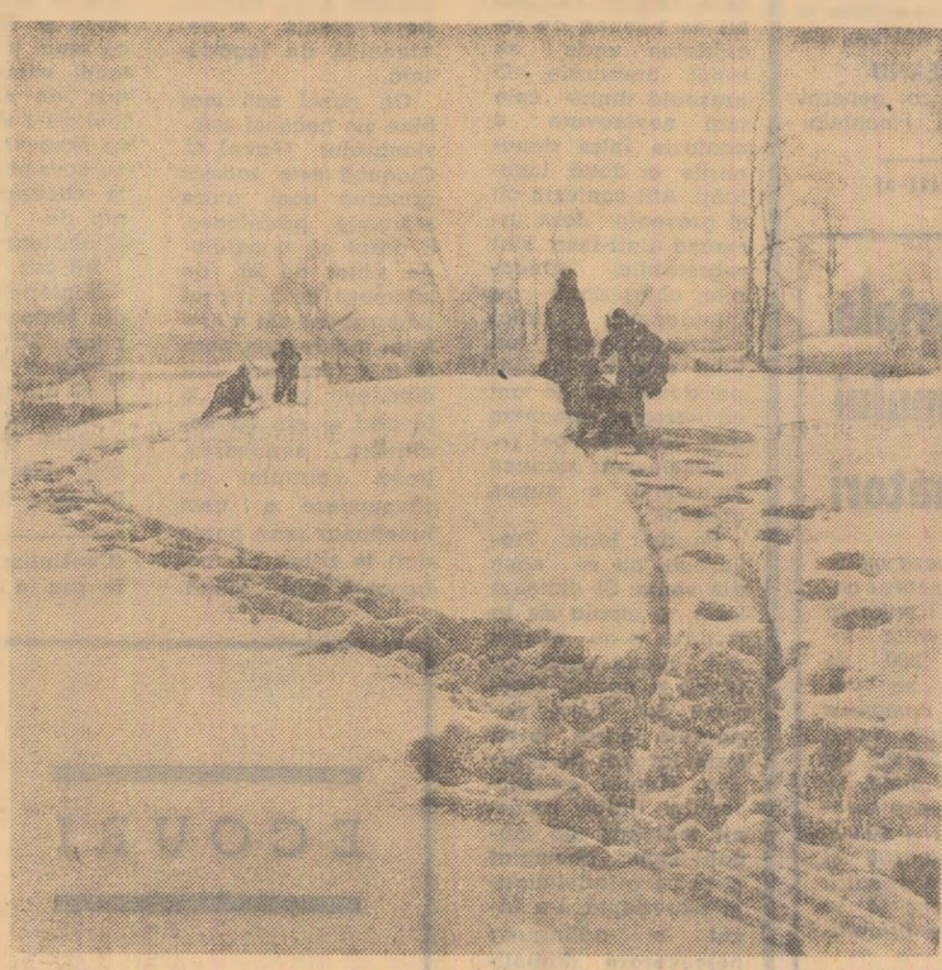
Ultima zi de vacanță

unităților comerciale. În fapt, o acțiune coordonată atât de largă pentru cercetări operaționale... (text continues)