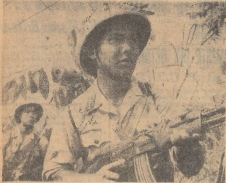
Apărătorii ai frontierelor R. D. Vietnam gata în orice clipă să dea ripostă hotărâtă agresorilor