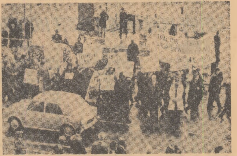
LONDRA. Demonstrație a muncitorilor din industria de automobile împotriva șomajului

ASSUAN 9 (Agerpres). — La Assuan au avut loc luni festivități prilejuite de împlinirea a șapte ani de la începerea lucrărilor de construcție a barajului de la Assuan, cel mai important obiectiv industrial aflat în construcție în R.A.U. Au participat membri ai guvernului, oaspeți străini și reprezentanți ai opiniei publice. Presa egipteană subliniază că pînă în prezent au fost efectuate 70 la sută din lucrările de construcție a barajului.