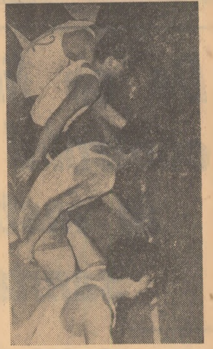
Sala Floreasca: Proba de 50 de m plăt