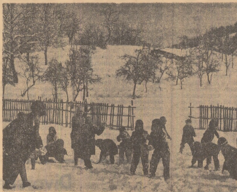
În recreație

— Ce părere aveți despre cultura artistică a creatorilor de modele din industria ușoară?