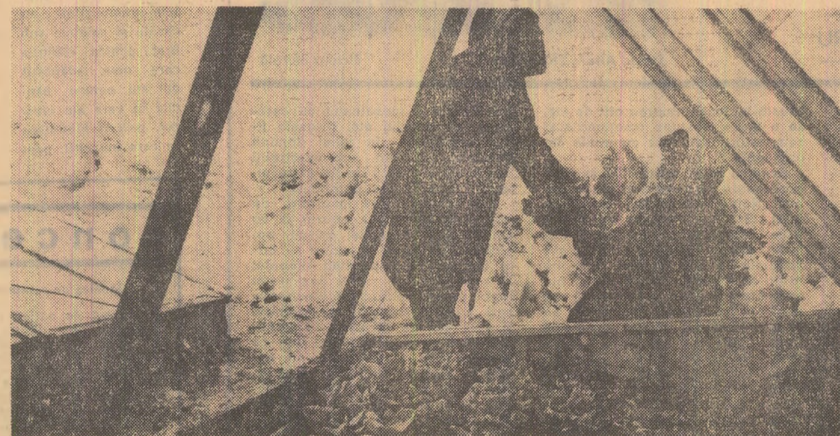
Salată verde în plină iarnă (în răsădnicile G.A.S. Sabarui, comuna Bragadiru)