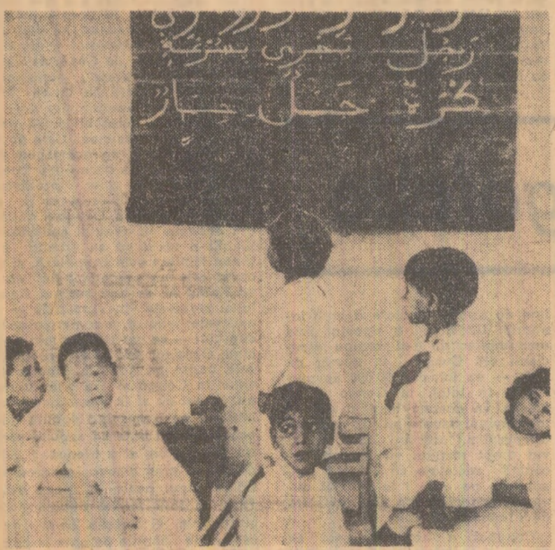
Pe planul instrucțiunii publice, în Tunisia este în curs o amplă campanie vizînd lichidarea analfabetismului, moștenire a dominației coloniale din trecut. În cadrul planului, înlocuiri de autorități, populația știtoare de carte, precum și învățătorii au fost chemați să acorde tot sprijinul acestei acțiuni. În fotografie: la o școală primară din Tunis

Un reporter de la ziarul „Times” a descoperit aruncate pe un trotuar din Chiseltown (o mică localitate de la periferia Londrei) documente secrete relative la rachetele americane „Hawk”, „Honest John” și altele. Documentele erau parțial arse. Ca și cum ar fi existat intenția de a le distruge — scrie „Times”. Cu siguranță că englezii ar fi respicit mai usor dacă ar fi aflat despre intenția de a distruge nu documentele secrete, ci, în cadrul unui acord de dezarmare, rachetele înseși.