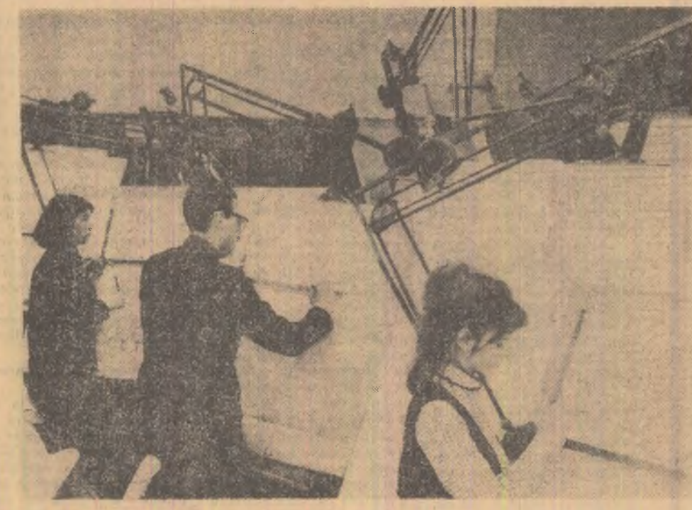
Pe planșetele proiectanților de la Uzina „Semănătoarea”-București capătă contur noile produse

Toate evenimentele prin care a trecut Congo-Kinșasa după 1960 — și nu sînt puține — au avut nici un efect asupra lui „Union Minière du Haut Katanga”. Producția sa anuală s-a menținut la același nivel: aproximativ 300 000 de tone de cupru. Este adevărat că această societate nu este străină de unele dintre aceste evenimente pe care le-a provocat pe care le-a încercat. Printre numeroasele calificative cu care a fost impropoziat Chombe figurează la joc de cîștig cel de „creator al lui Union Minière”. Numele acestei societăți a fost întotdeauna asociat, de asemenea, cu cel de secesinele katangheză. Reședința și sediul congolez, generalul Mobutu, deținea în cuvîntul său adresat popoului cu prilejul sfîrșitului anului 1965, vorbind despre „Union Minière”: „Ea a creat și a sprijinit în 1960 secesinele katangheză pentru a apăra beneficiile pe care le realizează. După aceea s-a angajat să provoace disrupția monedei noastre și să favorizeze traficul fraudulos al devalizilor.”