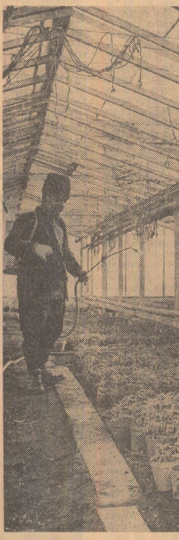
În serele cooperativei agricole din Drăganu, raionul Pitești

mărul și natura defectelor — varînd de la 10 la 40 la sută. Fiind, această practică nu poate să mobilizeze colectivele de întreprinderi, conducătorii lor, în degevrarea producției de acest balast. Dimpotrivă, se favorizează menținerea cupoanelor și bonificațiilor la un nivel ridicat. Considerăm necesar ca în volumul realizărilor, a fi la producția fizică cit și la cea valorică, să nu se mai includă aceste categorii de produse. Pe măsură ce cupoanele sînt valorificate, propunem ca sumele obținute să fie scăzute din costurile cauzate de producerea acestora. Măsura își găsește justificarea în faptul că nu poate fi considerată o realizare a întreprinderii producția care reprezintă pagube, diminuează rezultatele economice și financiare. De asemenea, se impune ca pirghiile cointerensării materiale pentru îmbunătățirea calității produselor să fie mai bine folosite. Fondul de premii al întreprinderilor ar trebui diminuat direct proporțional cu mărimea volumului de cupoane și bonificații, iar pierderile cauzate întreprinderii urmînd să fie suportate de cei care le provoacă. Răspunzători pentru pierderile cauzate de cupoane și bonificații sînt, în același timp, maeștrii și inginerii. Deci, se cere ca ei să suporte material daunele provocate. Economia națională nu poate subvenționa neprecizarea, slaba calificare, nu poate tolera perpetuarea deficiențelor generatoare de daune materiale și bănești.