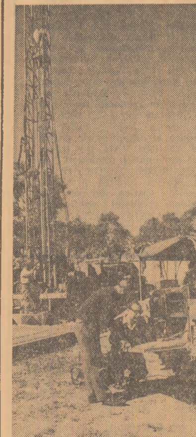
În Cipru, descoperirea unor noi surse de apă este o preocupare importantă. În clișeu: geologii caută pinze de apă

Agenciile occidentale au atras atenția asupra existenței în sinul armatei a unor forțe care îl sprijină pe Sukarno, cum ar fi trupele din Java de vest și marina militară, care are efective importante în regiunea capitalei indoneziane.