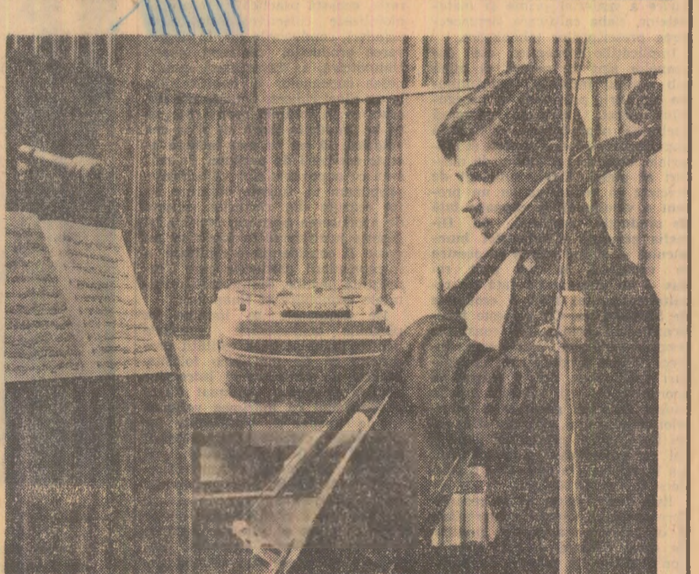
În Studioul de verificare și imprimări al Școlii de muzică nr. 2 din Capitală

matogra, prin intermediul unor casieri-remizeri numiți de ele și vor putea organiza în același timp spectacole la locul de muncă cu filmele preferate. În centrul orașului va fi înființată o agenție cinematografică unde vor fi puse la dispoziția spectatorilor bilete pentru oricare spectacol, acestea putînd fi procurate chiar și cu o săptămîină înainte de data solicitată. Cinematograful „Central” va fi profilat pe reluări valoroase, iar „Lucaefărul” va prezenta numai spectacole în avanspremieră, „Modern”, „Feroviar” și „Lumina” își vor alcătui fiecare reprezentanțele din două filme cuplate. La unele cinematografe vor rula săptămîni două sau trei filme, iar la altele materialele vor fi diferite de programul de după-amiază. Măsurile vin ca răspuns la doleanțele spectatorilor, precum și la propuneri făcute în presă.