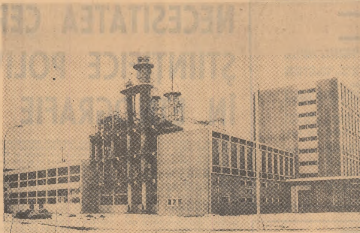
Noua secție lactama II de la Uzina de fire și fibre sintetice — Săvinești