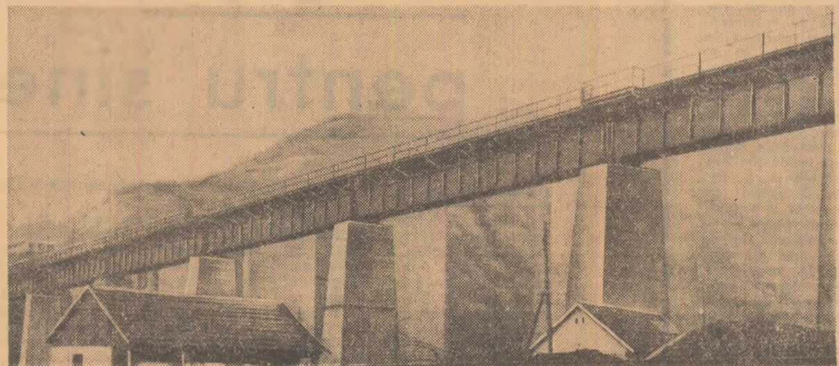
Viaductul de la Vaduța