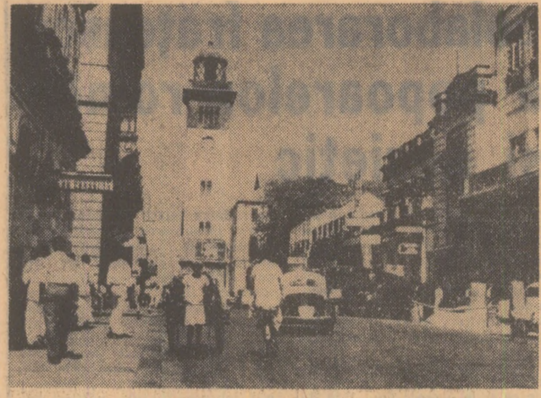
În Ceylon se sărbătorește astăzi Ziua independenței. În fotografie: vedere din Colombo, capitala țării