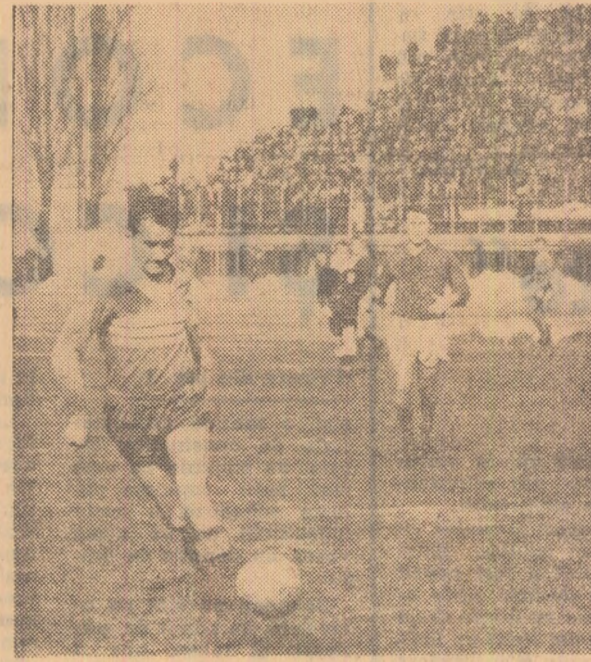
Pe stadionul „Giulesti”, echipele Rapid si Universitatea Craiova, lidera clasamentului, au furnizat ieri un pasionant meci. Rapidi au castigat la limita, prin golul inscris in prima repriza de Dumitriu Il. După pauza ei de beneficii de un penalty, dar Dan Cosic l-a ratat. In fotografie: fază din acest meci

La feminin, stafeta 3 X 5 kilometri a fost castigata de echipa A.S.A. Braşov (1h 12'30”).