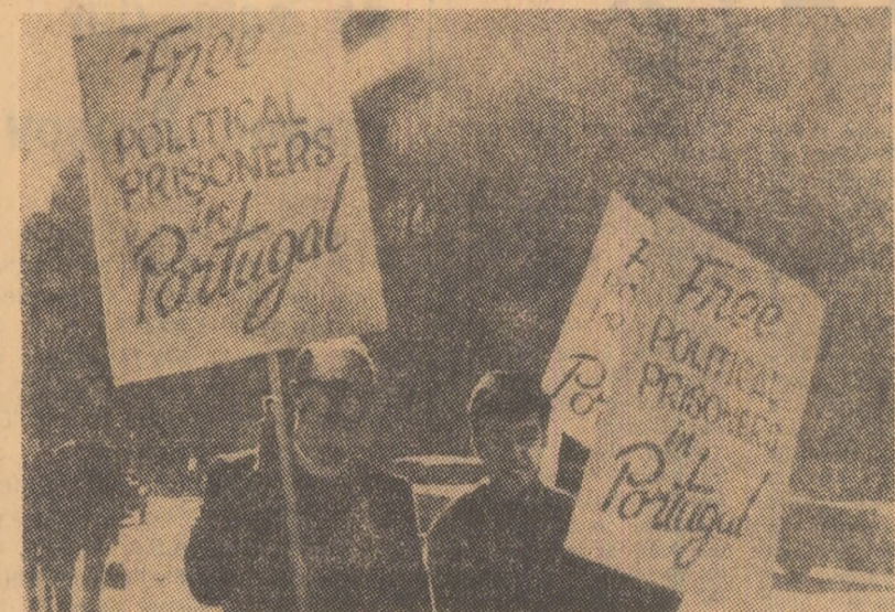
În fața consulatului portughez din Toronto (Canada), pichete de demonstrații cer eliberarea deținuților politici din închisorile salazariste