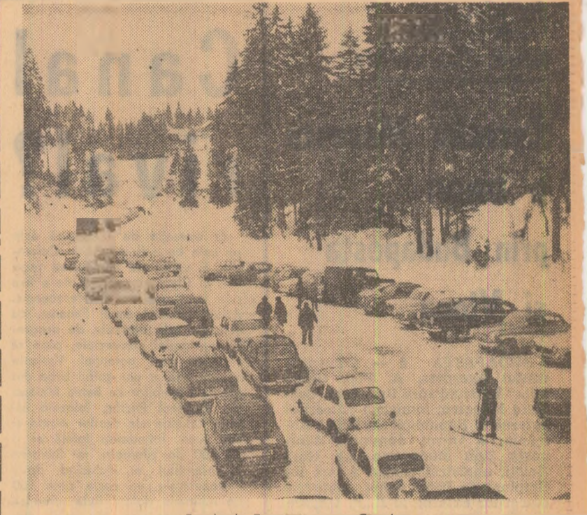
Predeal. Duminica pe Cioplea

Teri în țară: Vremea s-a ameliorat și a continuat să se încălzească în sud. Cerul a fost variabil, mai mult acoperit în Banat și Oltenia. Pe alocuri, în Transilvania, ceața a persistat. Vântul a suflat slab până la potrivit din sectorul vestic cu unele intensificări în regiunea muntoasă, unde a spulberat zăpada. Temperatura aerului la ora 14 era cuprinsă între zero grade la Joseni și 10 grade la Calafat. In București: Vremea s-a ameliorat și a continuat să se încălzească. Cerul a fost variabil. Vântul a suflat în general slab. Temperatura maximă a atins 9 grade. Timpul probabil pentru 7, 8 și 9 februarie. In țară: Vreme schimbătoare cu cerul temporar noros. Precipitații slabe și izolate. Vântul va sufla în general slab. Temperatura în scădere ușoară. Minimele vor fi cuprinse între minus 7 și plus 3 grade, iar maximele între minus 2 și plus 8 grade. Ceață locală. In București: Vreme schimbătoare, cu cerul temporar noros. Vântul va sufla slab până la potrivit. Temperatura în scădere ușoară. Ceață dimineața și seara, mai ales în primele zile.