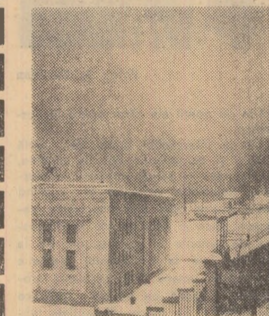
Hydrocentrala Moreni în decolul iernii

Dar studii s-au mai făcut și pînă acum. Ce e nou în această? Studiile despre care am amintit se deosebesc de cele anterioare prin faptul că urmăresc probleme fundamentale și de perspectivă pentru ramurile de bază ale industriei regiunii, prin faptul că vizează nu o singură soluție ci mai multe, din care să se aleagă cea mai rațională, în fine, prin aceea că la efectuarea lor participă numeroși specialiști nu numai din cei care lucrează direct în producție sau în aparatul de partid, ci și cercetători științifici și cadre universitare. Desigur, activitatea noastră nu se mărginește la studii. Concluziile desprinse sînt minuțios analizate, sînt confruntate în ședințe de birou, în plene ale comitetului, în adunări ale activului de partid, sugerîndu-ne o bogată sursă de măsuriri care stă la baza elaborării hotărîrilor ce se iau, a acțiunilor pe care le întreprindem. Fără îndoială munca noastră nu se măsoară în numărul de analize, ședințe, de studii întreprinse. Probabil că valoarea acestora o dau rezultatele, efectele economice obținute.