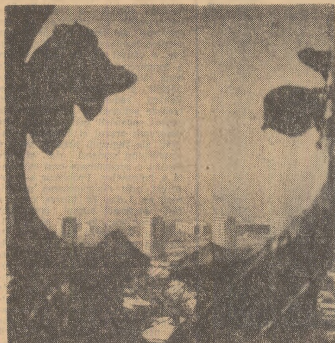
Perspectivă ieșeană

Construcția Complexului de cracare catalitică de la Brazi înainteză într-un ritm intens. O trecere în revistă a graficului de lucru arată că până acum planul de construcție pe structuri s-a realizat în proporție de 85 la sută. Unele din obiectivele planului fizic au fost date în folosință chiar înainte de termen. În prezent, constructorii de la S.C.M. Brazi lucrează de zor pe platforma de cracare. Se fac suduri aliate, se lucrează la construcția metalică a coloanelor instalației de hidrofinație a motorinei. De asemenea, se montează și compresorul de gaze și tuburi sulfante, precum și aparatele de măsură și control. Electricienii realizează montajul aparatului electric în stațiile de transformare și de pe platforma complexului.