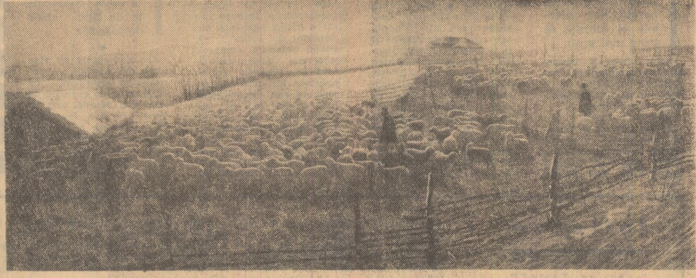
Sectorul ovin al cooperativei agricole din comuna Stîngăceaua, raionul Sîrehaia

La stația nr. 2 a Trustului de utilaj greu din Capitală a fost construit, pentru prima dată în țară, o hală industrială cu pereți din beton celular autoclavizat. Pereții au fost produși sub formă de panouri mari, slab armate, la fabrica de la Dolcești. Construcția hălei a impus respectarea unei anumite tehnologii, verificarea amănunțită a calităților fizico-mecanice, și alte măsuri speciale de transport, manipulare și depozitare a panourilor. La realizarea acestei lucrări și-au adus contribuția cîți specialiștii institutelor de specialitate din industria materialelor de construcții, cîți și lucrătorii întreprinderii nr. 8 de construcții-montaj din București. (Agerpres)