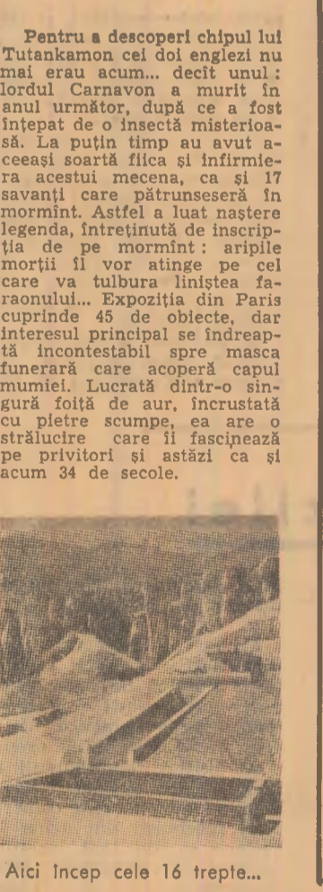
Aici încep cele 16 trepte...

După cât se pare, nici o altă descoperire arheologică nu suscită vreo dată atâtea ecouri ca aceea pe care, într-o zi de noiembrie a anului 1922, au făcut-o doi englezi, Zeno și Howard Carter, care conducea săpăturile începute cu 13 ani înainte în Valea Regilor pentru a da de un singur mormânt: al lui Tutankamon, și lordul Carnarvon, care-l finanța pe arheolog. Cei doi erau tocmai pe cale să abandoneze când, în timpul unei ultime lovitură de fieră, Carter a descoperit o treaptă: prima din cele 16 care ducneau la mormântul zidit al copilului-lege. Deschiderea mormântului a avut loc la 22 noiembrie, și în fata lor apără cel mai fabulos tezaur din toate timpurile: o grămadă de aur, filde, alabastru, bronz admirabil sculptate, paturi funerare, statui, cutere, bijuterii și obiecte ale vechii civilizații egiptene aproape 2.000 de ani vechi, a căror clasare și transportul muzeului din Cairo a durat șase ani. Toate acestea, fără a enumera mumiile înăuntrul cărora protejate de trei sarcofagi puse unul în altul.