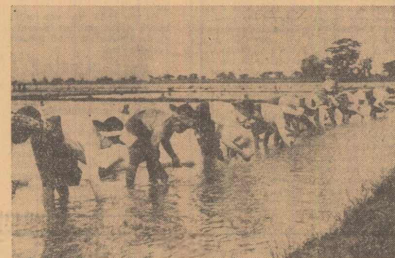
Pe ogoarele Birmaniei se apropie de sfîrșit sîdirea rîsădurilor de orez din recolta de primăvară

Ziarul mexican „Ovaciones” anunță că va publica o scrisoare misterioasă sosită de pe o altă planetă. Autorul extraterestru, Kan Ian tsu-ku, relatează despre „vizitele” sale pe pămînt la bordul unei „farfurii zburătoare”. Planeta de pe care vine și al cărei nume nu-l dezvăluie s-ar afla la 16 mii ani lumină distanță de pămînt, seamănă cu Terra noastră, doar că are o vegetație mai bogată. În trecutul îndepărtat, se spune în scrisoare, semenii de-a lui Kan Ian tsu-ku ar mai fi vizitat globul terestru. Cu cîva timp în urmă, un grup de savanți care experimentau formulele unor mesaje transmise în Cosmos au primit răspuns... Era de la un radioamator terestru.