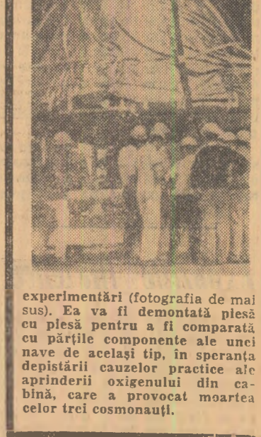
experimentări (fotografia de mai sus). Ea va fi demontată și plasată pe pămînt pentru a fi comparată cu părțile componente ale unei nave de același tip, în speranța depistării cauzelor practice ale pierderii oxigenului din cabină, care a provocat moartea celor trei cosmonauți.

NEW YORK. Cabina „Apollo” în care și-au pierdut viața cei trei cosmonauți americani a fost dată jos de pe racheta „Saturn”, unde se afla instalată în momentul tragediei