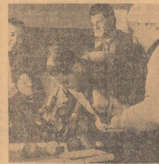
Comuna Dumbrăveni, regiunea Suceava. În aceste zile cooperarii vizitează adeseori Casa agronomului