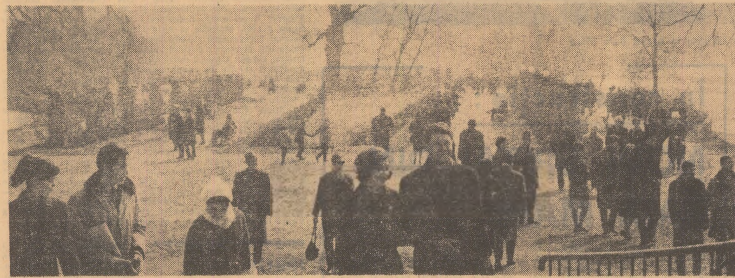
Vine primăvara! Ieri în parcul Herăstrău din Capitală

Anul XXXVI Nr. 7265 Luni 27 februarie 1967 4 PAGINI — 30 BANI