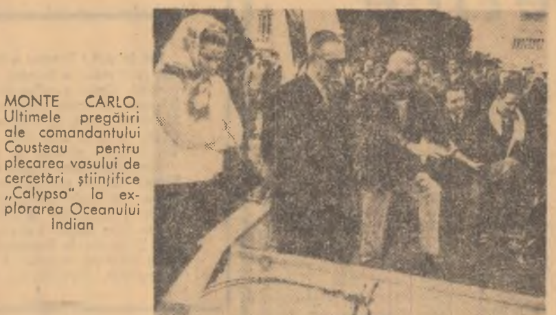
MONTE CARLO. Ultimele pregătiri ale comandantului Clocseac pentru plecarea vasului de cercetări „Calypso” la explorarea Oceanului Indian

HAGA 25 (Agerpres). — Primul ministru al Marii Britanii, Harold Wilson, a sosit duminică după-amiază la Haga. Olanda este cea de-a 5-a etapă a turneului pe care premierul englez îl întreprinde în mai multe țări europene, cu scopul de a sonda șansele Marii Britanii privind aderarea la Piața comună. Potrivit agenției Reuter, în anumite cercuri politice de la Haga s-a exprimat părerea că în cursul convorbirilor, premierul Wilson ar putea obține sprijin în problema aderării Angliei la C.E.E.