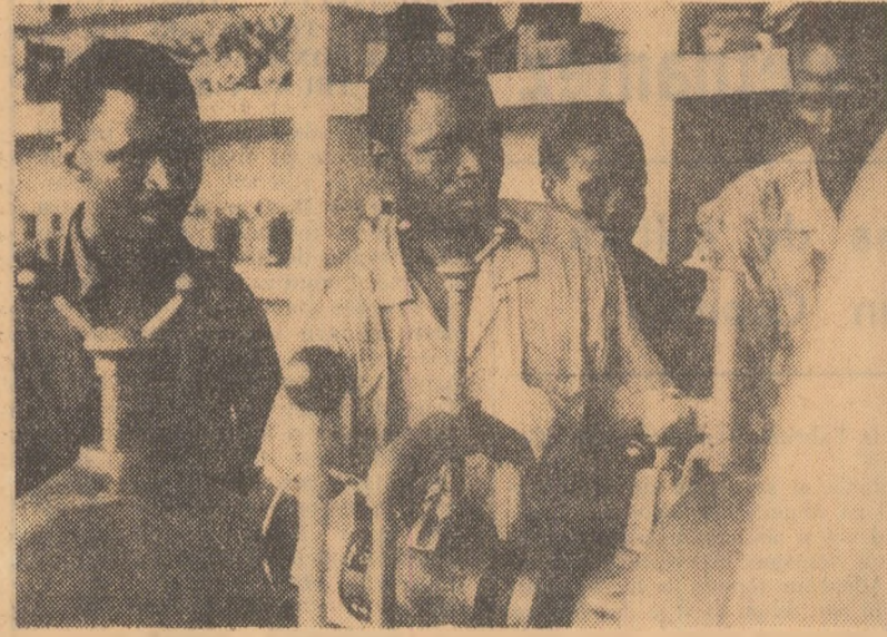
În secția de montaj a unei noi unități industriale din orașul Conakry (Guineea)

De la alegerea legislativă, care au avut loc la 15 februarie, noua misiune a lui Biesheuvel reprezintă a patra încercare de a forma un cabinet, care să pună capăt crizei de guvern.