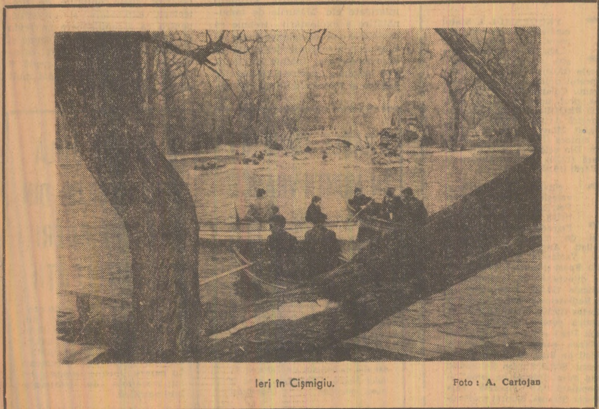
lari în Cișmigiu.