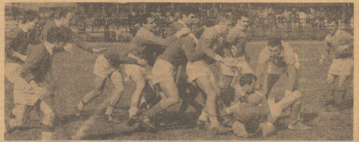
Grivițenii n-au reușit decât o victorie la limită (3-0) în fața echipei ieșene.

● SUCCESE ROMANEȘTI LA CAMPIONATUL MON- DIAL DE SCRIMĂ — TI- NERET ȘI LA CROȘUL BALCANIC. ● IERI, ZI PLINĂ LA FOTBAL: RA- PIDIȘTII AU CISTIGAT DUELUL CU CRAIOVENII; A REINCEPUT CAMPIO- NATUL CATEGORIEI B. ● UNIVERSITATEA TI- MIȘOARA A RATAT CA- LIFICAREA ÎN FINALA C.C.E. LA HANDBAL-FE- MININ. ● ALTE ȘTIRI DIN ȚARĂ ȘI DE PESTE HOTARE