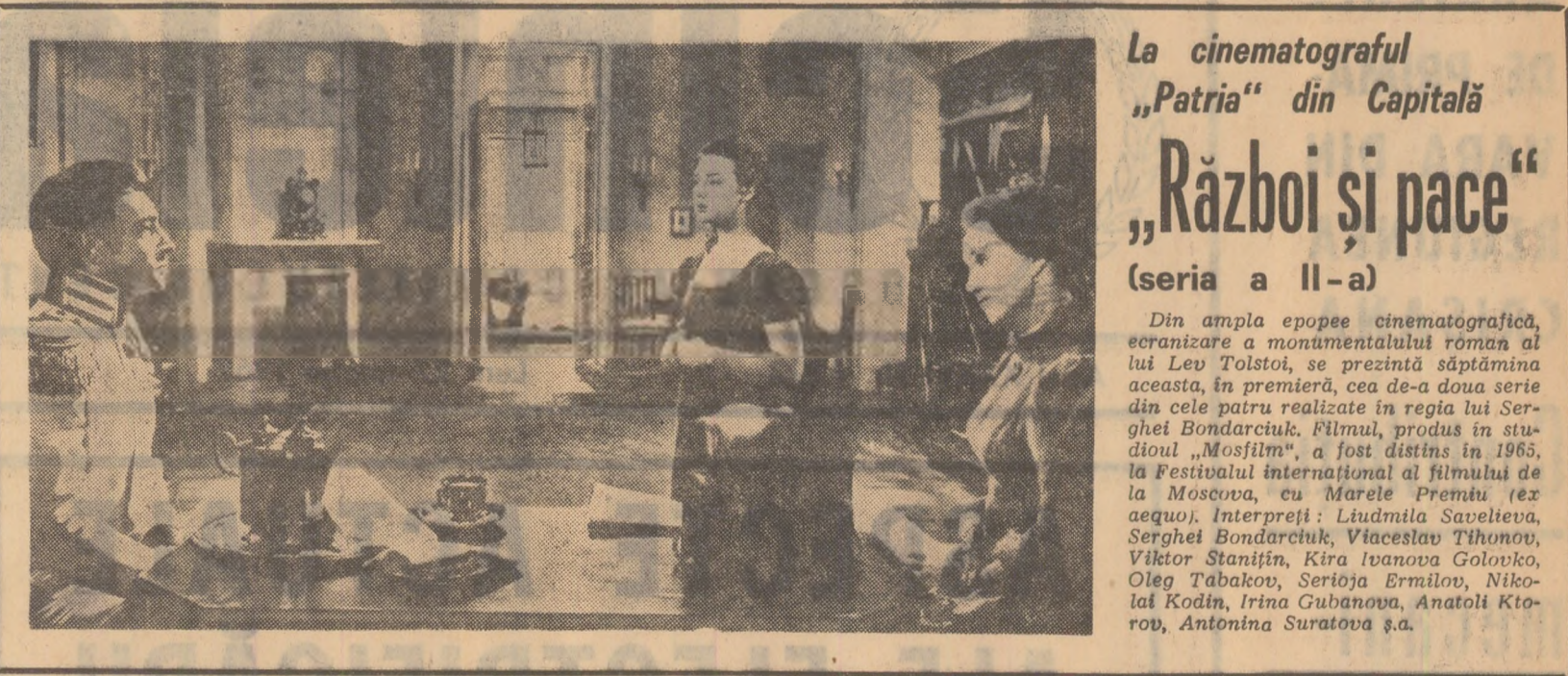
La cinematograful „Patria” din Capitală „Război și pace” (seria a II-a)