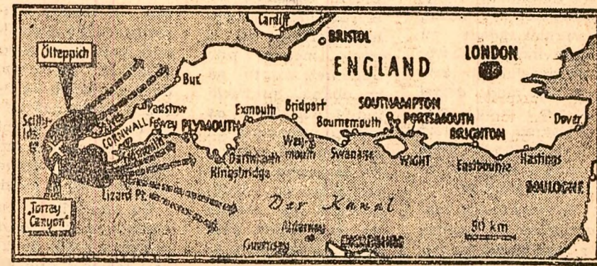
Harta de mai sus reproduce din ziarul vest-german „Die Welt” arată locul în care a eșuat petrolierul „Torrey Canyon” și direcțiile în care înaintă stratul de petrol. Agenția France Presse transmite că petrolierul amenință coastele Franței. Un raport în acest sens a fost prezentat ministrului din Franța. A fost declarat starea de urgență, stratul de petrol fiind duminică dimineața la 50 km de coasta franceză pentru a înfînta pericolul, guvernul a adoptat duminică dimineața un program de măsuri, printre care, în primul rînd, stocarea unei mari cantități de detergenți