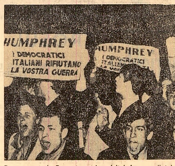
Demonstrație la Roma împotriva vizitei vicepreședintelui S.U.A., Humphrey

Dezvoltarea colaborării economice și tehnice între R. D. Germană și R. S. F. Iugoslavia. La Berlin au luat sfîrșit convorbirile dintre Gerhard Schürer, președintele Comisiei de Stat a Planificării și R. D. Germană și Hakia Federat, secretar federal pentru problemele industriei și comerțului al R.S.F. Iugoslavia, aflat în vizită în această țară. Ambele părți au constatat existența posibilităților pentru dezvoltarea în continuare a colaborării economice și tehnice dintre cele două țări.