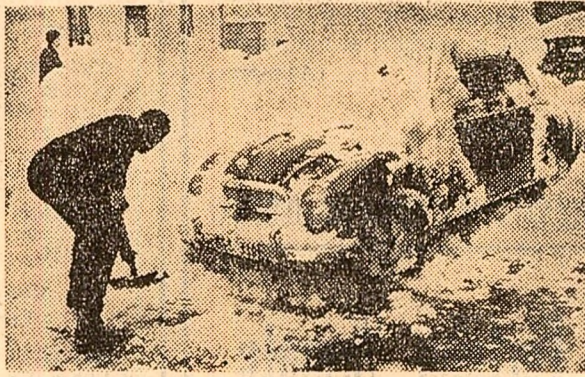
Ninsoare abundentă la Goeschenen, în Elveția

Într-un articol publicat după prezentarea ultimelor filme, ziarul „Paese Sera” scrie: „prin filmele „Pădurea spinzuraților” și „Duminică la ora șase” își dezvăluie jașa o cinematografie care are un cuvînt serios de spus... Este un bilanț pozitiv”, conchide ziarul.