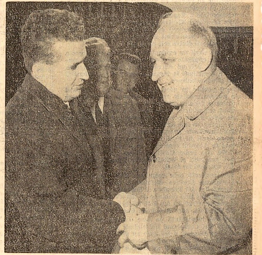
Vineri la amiază a părăsit Capitala, îndreptîndu-se spre patrie, delegația de partid și guvernamentale a Republicii Populare Bulgaria, condusă de tovarășul Todor Jivkov, prim-secretar al Comitetului Central al Partidului Comunist Bulgar, președintele Consiliului de Miniștri al Republicii Populare Bulgaria, care, la invitația Comitetului Central al Partidului Comunist Român și a Consiliului de Miniștri al Republicii Socialiste România, a făcut o vizită oficială în țara noastră.

Pe întregul traseu, zeci de mii de bucuuresteni au salutat prieteneste pe reprezentanții poporului frate bulgar. Șoseaua este împodobită cu drapelule românești și bulgare; se văd lozinci pe care scrie: „Trăiască și înflorirească prietenia frățească dintre popoarele românești și bulgare!”, „Trăiască unitatea mișcării comuniste și muncitorești internaționale!”. Se aud aclamații și urale puternice pentru prietenia ce leagă cele două popoare, pentru colaborarea dintre cele două țări și partide frățești. Tovarășii Todor Jivkov și Nicolae Ceaușescu răspund, dintr-o mașină deschisă, ovățiilor și aplauzelor numerosilor locuitori ai Capitalei aflați de-a lungul bulevardelor.