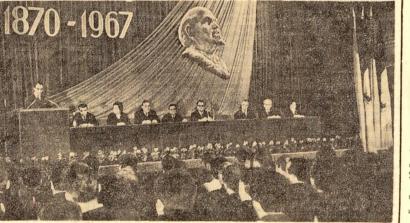
Aspect de la adunarea solemnă