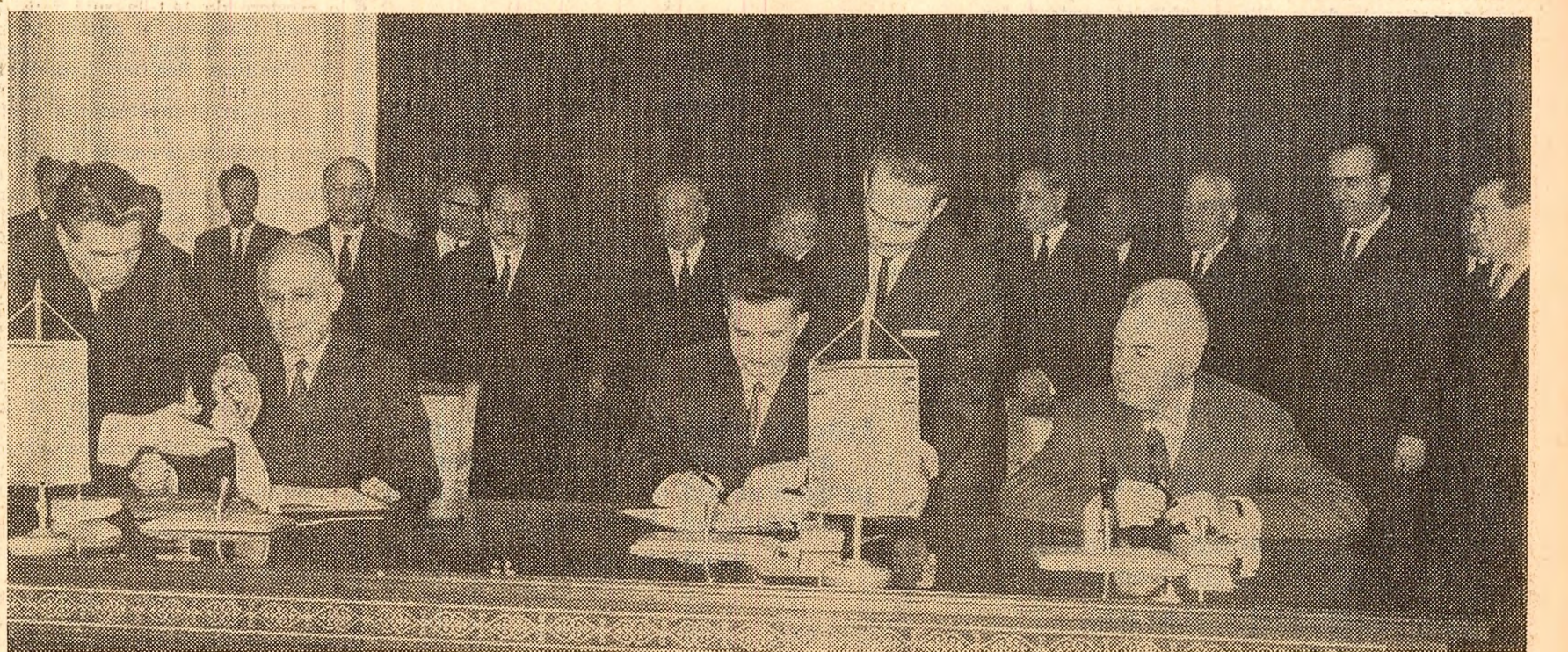
În timpul semnării comunicatului.