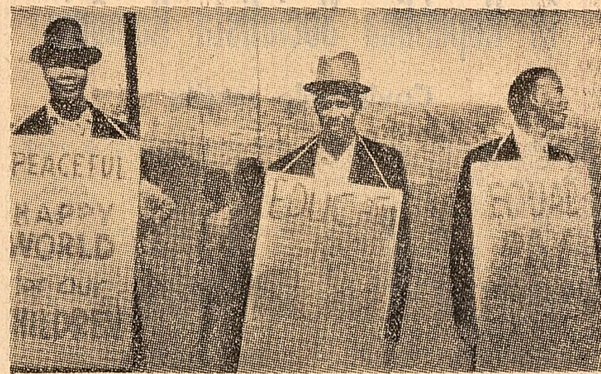
„Vrem o lume mai bună”; „Educație — nu slavie” — revendică victimele apartheidului din Transkei, una din cele mai întinse rezerve pentru oameni de culoare din Africa de Sud

În ziua de 24 aprilie s-a deschis la Karlovy Vary-Cehoslovacia, o conferință în problema securității europene. La conferință participă partide comuniste și muncitorești din țări socialiste și din țări capitaliste din Europa. Intrucit în cursul schimbului de păreri și consultărilor care au avut loc nu s-a ajuns la un acord comun prealabil privind caracterul, scopul și modul de desfășurare a conferinței, Partidul Comunist Român nu participă la această conferință. După cum anunță agenția C.T.K. la conferință nu iau parte Uniunea Comunistilor din Iugoslavia, Partidul Muncii din Albania, Partidul Comunist din Olanda, Partidul Comunist din Norvegia, Partidul Socialist, Unit, din Islanda, Partidul Comunist din Suedia — informează agenția C.T.K. — nu a trimis o delegație, ci un reprezentant în calitate de observator.