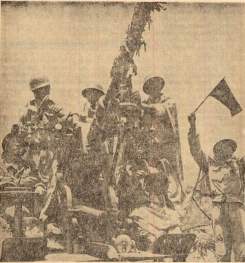
De straig spajfului cerian al R. D. Vietnam

Conferința minerilor din South-Wales a adoptat o rezoluție care cere guvernului laburist să condamne bombardamentele barbare ale aviației S.U.A. asupra R. D. Vietnam.