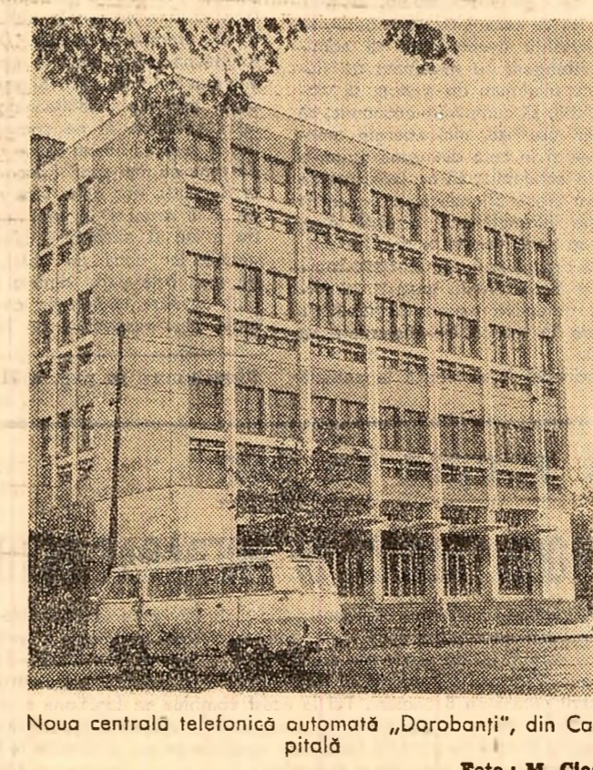
Noua centrală telefonică automată „Dorobanți”, din Capitală.

Un director de teatru e criticat că a jucat cutare piesă contemporană, nicodată pentru ce n-a jucat, spiritul lui se modifică în sens restrictiv, nu extincționează. Omissioniune, în cultură, nu se penalizează. Cred că ar trebui să înțelegem cu toții că marile izvoare ale muncii și creativității au o anumită putere cu care își nesec, o anumită dinamică, un anumit potențial, și că tot ce reduce acest potențial înseamnă o sîrșicire, o pădure, presupune o culpă și trebuie plătit. Așa cum masa lemnoasă dintr-o pădure se cuvine valorificată cîi mai integral, transformată în sortimente cîi mai viabile, așa și rîvna creatorilor, profesionalizate, avîntul muncii trebuie să atingă valorificarea maximă, deșeurile (neizburile, tergiversările, omisiunile, șicanele) să rămîină minime. Cine blochează prin omisiune cursul avutului creator, cine complică inutil și remite la neșfîrșit, strîcî, și cine strîcî trebuie să desdăuneze.