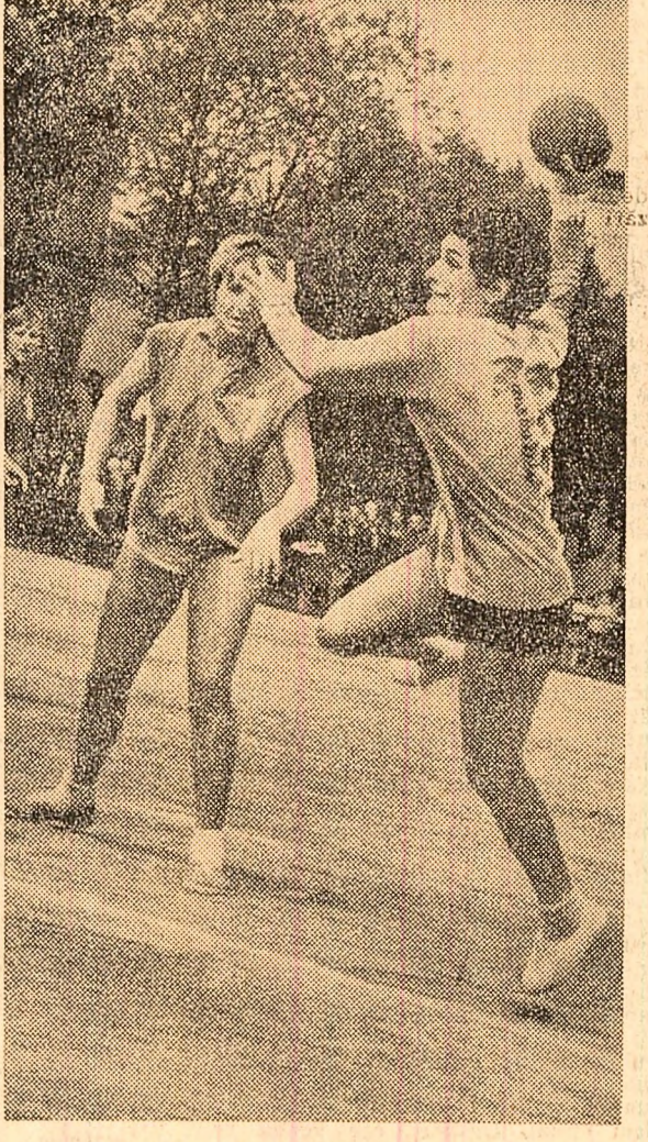
Derbiul campionatului feminin de handbal, Rapid—Universitatea Timișoara, a revenit rapidistelor cu 10—4

SPORT ● Voleibalistele de la Dinamo București din nou campioane ● FOTBAL: Rezultate din categoriile A și B ● Sportivi români peste hotare