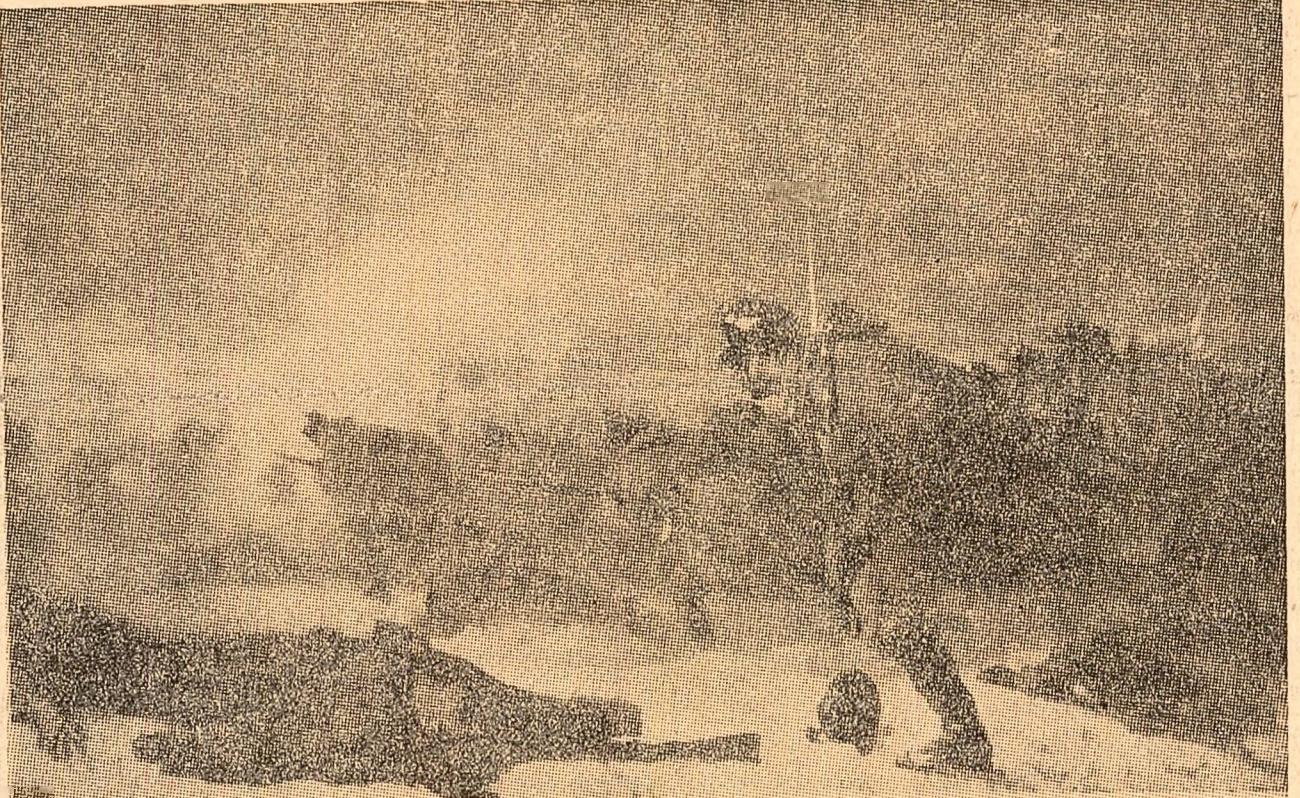
N. GRIGORESCU „Atacul de la Smirdan“

„Juni ostași ai țării mele, însemnați cu stea în frunte! Dragii mei vulturi de cîmpuri, dragii mei șoimani de munte! Am cîntat în tinerețe strămoeșca vitejie, Vitejia țării seamănă pe-acel timp de grea urgia a adus un renunț Dus pe Dunărea în Marea și din Marea dus în lume! Vin acum, la rîndul vostru, să v-aduc o-nchinare, Vin cu inima crescîndă, și cu sufletul mai tare, Ca eroii de mari legende, vin să vă privesc în față“.