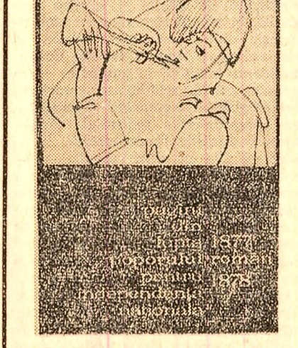
„PAGINI DIN LUPTA POPORULUI ROMÂN PENTRU INDEPENDENȚA NAȚIONALĂ” (1877—1878)

Presă europeană a scos în evidență eroismul armatei române și importanța aportului ei la obținerea victoriei. Ziarul belgian „Le Bien Public” scria că „românii s-au purtat cu vitejie, ei au luat o mare parte la impresurarea Plevnei și la înfrîngerea definitivă a lui Osman Pașa, care a hotărî rezultatul campaniei; ei și-au dovedit în război, ca și în pace, dreptul de a exista ca națiune independentă”. Ziarul francez „Memorial diplomatique” arăta că: „Românii au contribuit foarte mult la strălucita luptă care a dus la luarea Plevnei. S-ar putea chiar zice că într-un moment critic ei au salvat situația acestei zile”.