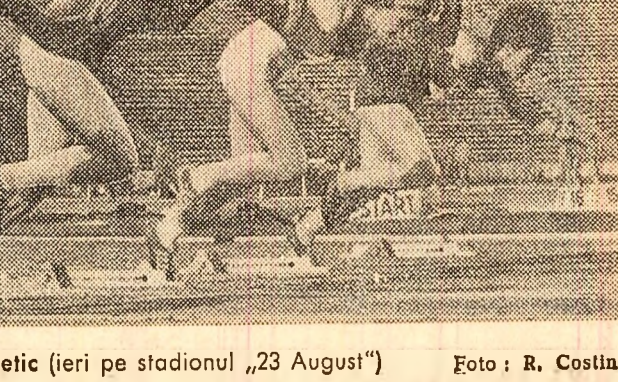
Sincron atletice (ieri pe stadionul „23 August”)

ÎN PRIMUL MECI AL TURNEULUI pe care-l întreprinde în Australia, echipa de rugbi a Irlandei a învins cu scorul de 11-5 (6-0) selecționata australiană.