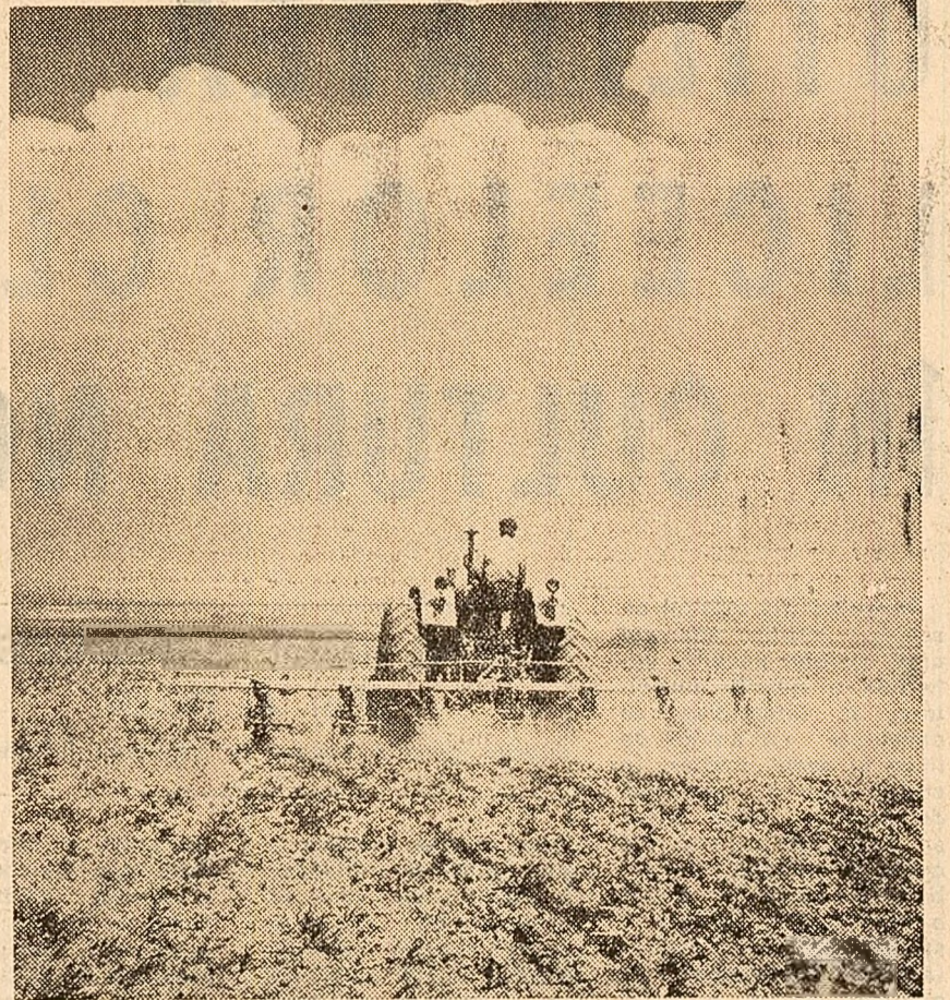
În cooperativa agricolă Berești-Bistrița, raionul Bacău se execută lucrările de îngrijire a culturilor cu ajutorul mașinilor de la S.M.T.

Ing. Virgil BOAC directorul Complexului de industrializare a lemnului Gălbouș