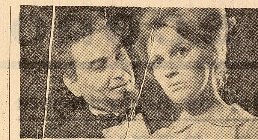
Scenă din piesa „R.U.R.” de Karel Capek, la Teatrul de Stat din Galați

Pentru limba engleză, care este o limbă germanică, limba latină constituie și azi un izvor de neologisme. Această lucrare se înfățișează ca o carte de referință pentru un om cult este o necesitate curentă și știe că înseamnă un conleiner, o rachetă, a propulsa, a ton, balistică etc. Pentru cine nu cunoaște cele două limbi clasice, toată terminologia din cele mai obișnuite domenii ale vieții cotidiene este o lămură cu totul aparte. Pentru a servi la pregătirea unor viitori cercetători înseamnă că instrumentele de lucru necesare, aceste noi unități școlare vor avea o atmosferă, un profil și o finalitate bine determinate. Se va începe în anul școlar 1967/1968 numai cu câteva astfel de unități. Planurile de învățămînt, programele și procesul de învățămînt vor fi în acord cu finalitatea specifică acestor licee și cu profesionale în perspectivă. Poate că va fi necesară o perioadă de practică științifică (în ultimul an al liceului), efectuată pe școlile arheologice, în arhivele statului, în depozitele de manuscrise și cărți vechi ale bibliotecilor etc. Această perioadă de practică științifică credem că va servi interesul elevilor pentru studii și totodată va servi orientării lor spre specialitățile cărora se vor consacra.