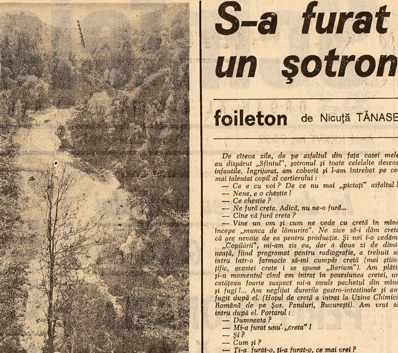
Valea Oilefului. In apropiere de Polovragi