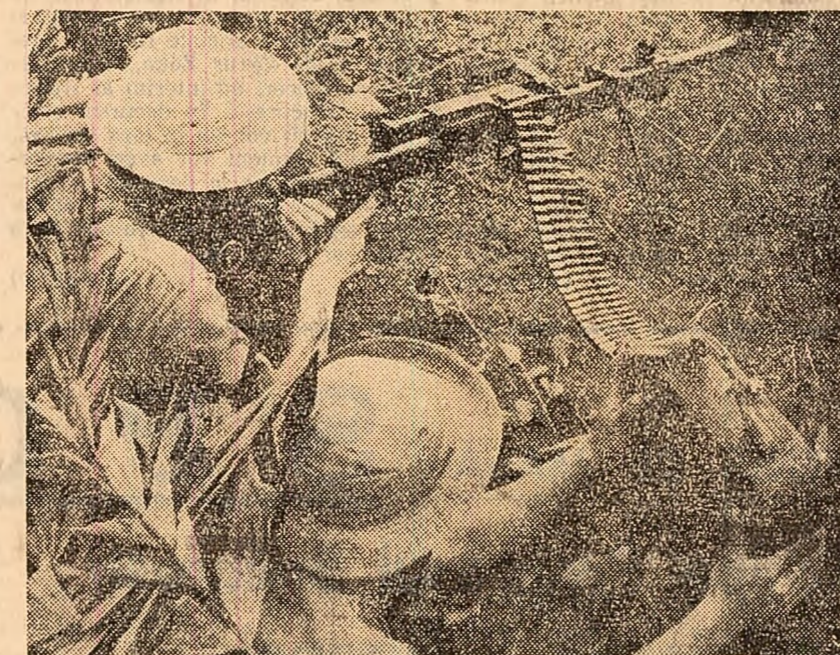
Un post de mitralieră al forțelor patriotice sud-vietnameze

SAIGON 25 (Agerpres). — Potrivit știrilor transmise de agențiile occidentale, pierderile înregistrate în cursul ultimei săptămâni (14-20 mai) de trupele americane care luptă în Vietnamul de sud se ridică la 2.619 oameni, dintre care 337 uciși, iar 2.282 răniți. Este cel mai sumbru bilanț săptămânal înregistrat de trupele americane de la începutul războiului din Vietnam, precizează agenția France Presse.