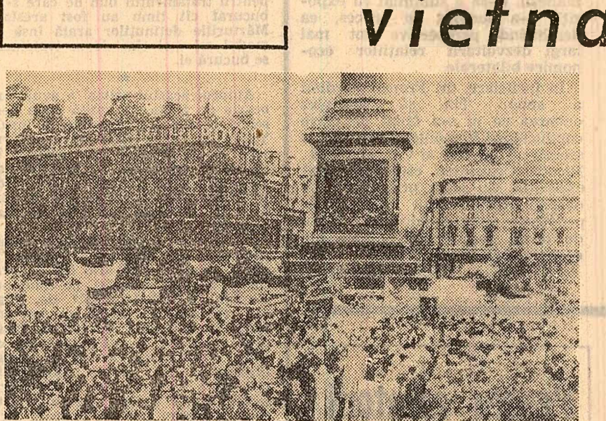
Demonstrații pe străzile Londrei

CORESPONDENȚA DIN LONDRA DE LA LIVIU RODESCU