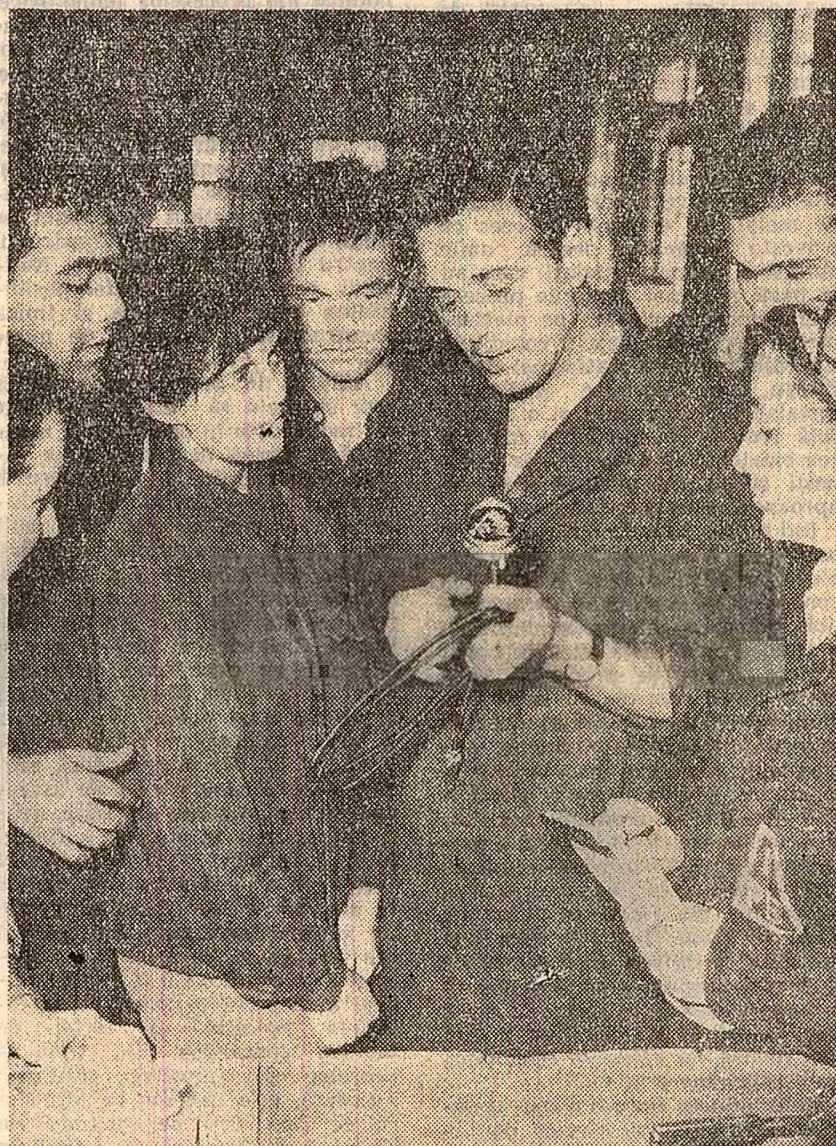
A început practica în producție a studenților. Și odată cu ea, frecvențele și rodnicile contacte științifice cu specialiștii uzinelor, șantierelor, agogatorilor.