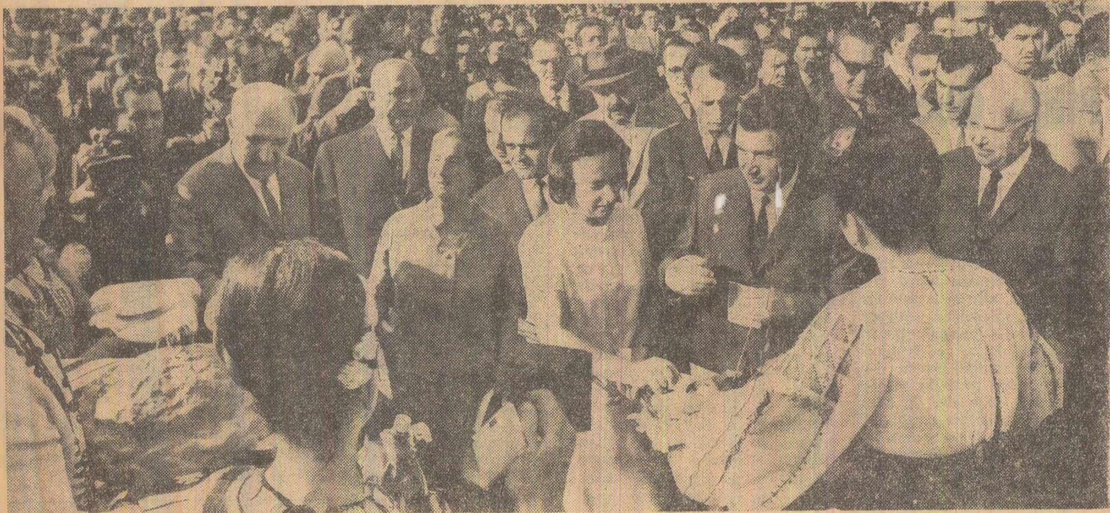
Întîmpinați cu pline și sare, conducătorii de partid și de stat, însoțiți de oaspeții bulgari, pășesc în expoziția tîrg din Piața Obor.