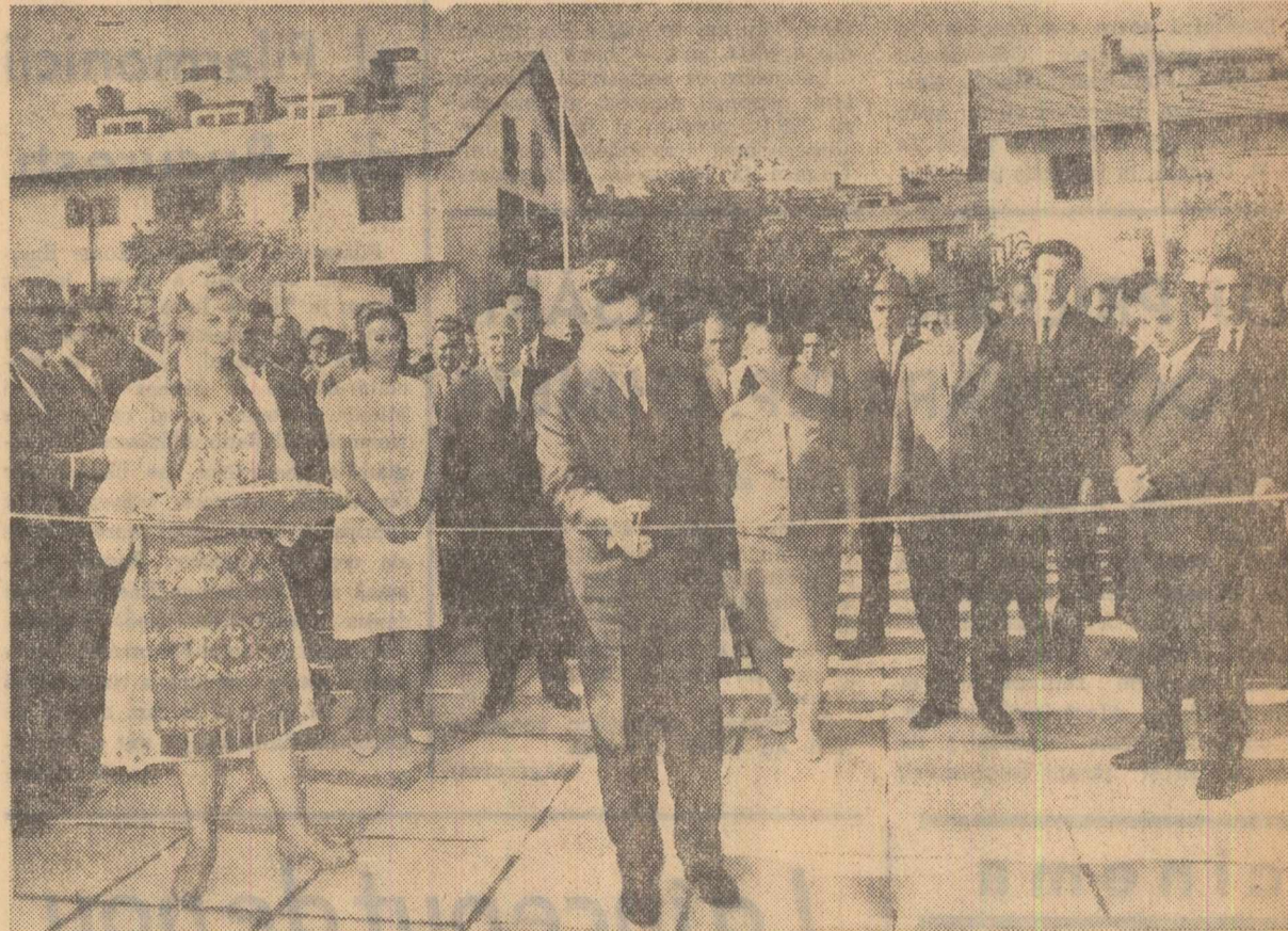
Se inaugurează expoziția zootehnică amenajată în cartierul Floareașca din Capitală

De la un capăt la altul al regiunii, în comunele și satele împodobite sărbătorite, țărănimia cooperatistă, lucrătorii din unitățile agricole de stat, oameni ai muncii români, maghiari și de alte naționalități au petrecut în cinste, joc și voie bună. Începînd de duminică, în raionul Reghin, o caravană formată din mai multe care alegeorie, în care au fost expuse mostre de cereale, legume, fructe, produse zootehnice ale cooperativei agricole și întreprinderilor de stat, însoțite de orchestre populare, au colindat satele. Pretutindeni — oameni bucueroși de rodul bogat al pămîntului. Tarabe pline cu bunătăți spe-