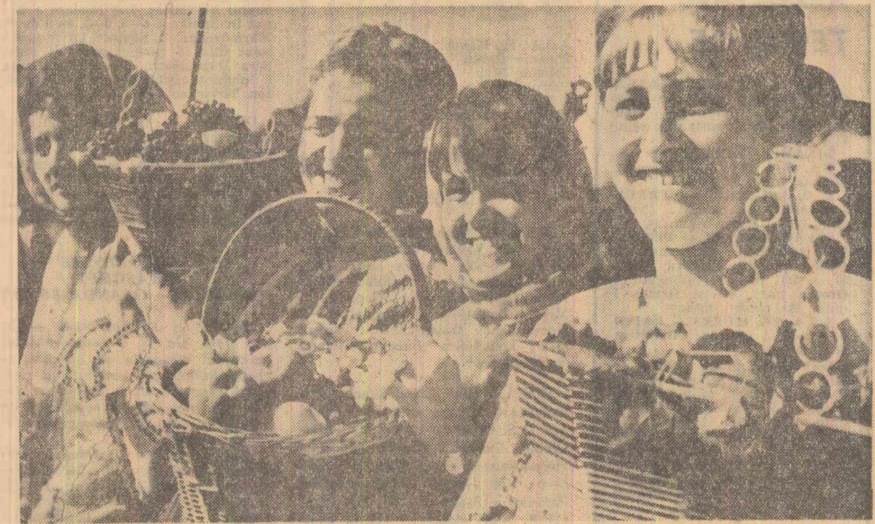
La Pitești, simbol al belșugului și al bunăstării

Minerii, siderurgiiștii, constructorii, oameni de diferite profesii, și-au dat întâlnire cu lucrătorii din agricultură pentru a cînti împreună prin cîntec și joc, după datina străbună, rodul ogoarelor. Pe estradele special amenajate în aer liber au fost prezentate programe artistice. La Alba Iulia, peste 10.000 de tineri au luat parte la festivalul tineretului hunedorean. Aici, la poarta întia a cetății, tineri în costume moștite deschid drumul coloanei spre obeliscul lui Horia. Omagiul conducătorilor răscoalei țărănești este adus de corul liceului din oraș și de un colectiv al Teatrului de stat din Petroseni, care interpretează un fragment din piesa „Procesul lui Horia”.