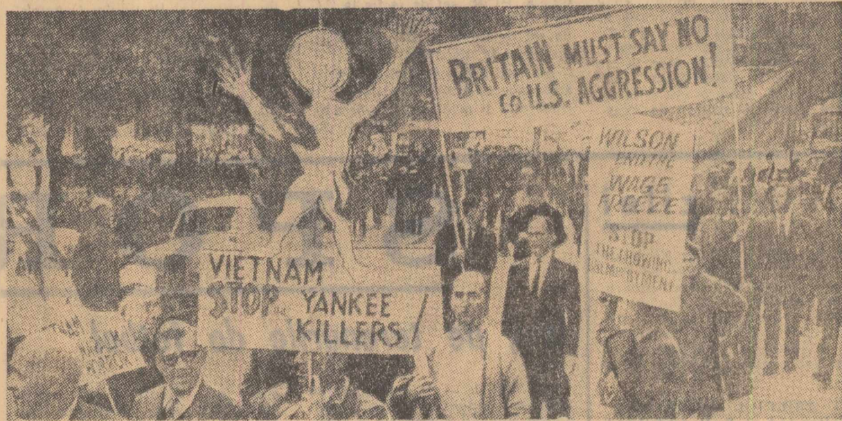
Anglia. O imagine din timpul unei recente demonstrații a londonezilor împotriva agresiunii S.U.A. în Vietnam

● După cum anunță agențiile de presă, în cursul primelor opt luni ale anului 1967 producția vest-germană de automobile a scăzut cu 25 la sută în raport cu perioada corespunzătoare a anului precedent. Acoastă scădere a fost de 24,3 la sută pentru autoturisme și de 27,9 pentru autovehiculele utilitare. De asemenea, au scăzut cu 15 la sută și exporturile vest-germane de automobile.