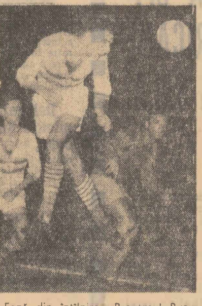
Fază din întâlnirea Progresul București — Honved Budapesta

BUCUREȘTI. — În noaptea, pe Stadionul Republicii, echipa maghiară Honved Budapesta a susținut primul ei meci din turneul ce-l întreprinde în țara noastră, jucând cu Progresul București. Cum se întâmplă uneori în fotbal, o echipă a dominat, iar cealaltă... a cistigat.