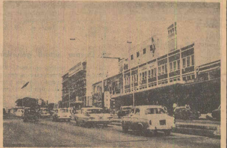
Vedere din capitala țării, Kampala

După opt decenii de dominație colonială, la 9 octombrie 1962, Uganda s-a proclamat stat independent. A cincea aniversare găsește poporul acestei țări în plin efort pentru depășirea situației de subdezvoltare economică moștenită de la colonialiști. Se dă prioritate dezvoltării industriei prelucrătoare, creșterii producției agricole, dezvoltării învățămîntului și largirii mijloacelor de asistență sanitară.