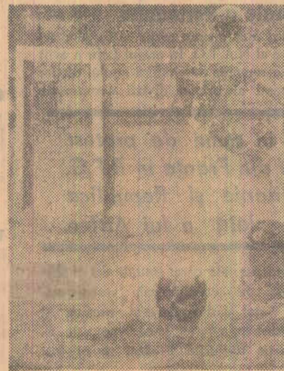
Ieri dimineață în Capitală la bazinul „Tineretului” a avut loc meciul de polo pe apă dintre Rapid București și Vagonul Arad. Au învins rapidiștii cu scorul de 6-4.

Turneul internațional de gheață de la Winnipeg (Canada) a continuat cu desfășurarea partidelor din runda a 4-a. Florin Gheorghiu (care terminase remiză priorioară în fața lui Kagan și totalizează acum 2,5 puncte. În clasament conduce Larsen cu 2,5 puncte și o partidă întreruptă. Keres, Spasski și Matanovici totalizează, de asemenea, câte 2,5 puncte.