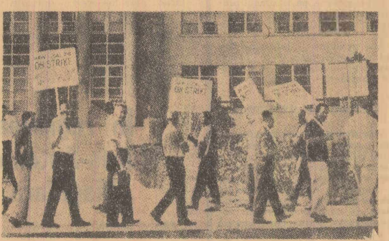
Greva muncitorilor de la „Ford” (S.U.A.). În fotografie: Pichete de greviști în fața uzinei din Detroit

comparație cu majoritatea obținută anul trecut în aceeași problemă de 2.208.000. John Gollan subliniază importanța adoptării de către conferință a rezoluției ce cheamă guvernul să se disocieze de războiul dus de S.U.A. în Vietnam, care a dovedit că guvernul englez în problema vietnameză se află într-o situație de izolare deosebit de dificilă. În încheiere, John Gollan cheamă la intensificarea eforturilor menite să determine guvernul Wilson să-și schimbe politica.