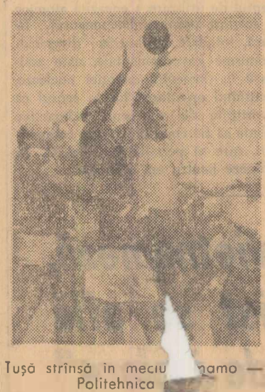
Tușo strinsă în meciul „nomo” — Politehnica

„Cartierul general” al rugbiștilor în etapa de ieri a fost situat la stadionul Tineretului, pe terenurile cărora s-au desfășurat meciurile din ambele divizii. În centrul atenției a stat cupajul Progresul-Agronomia Cluj și Dinamo-Politehnica Iași. Meciu de