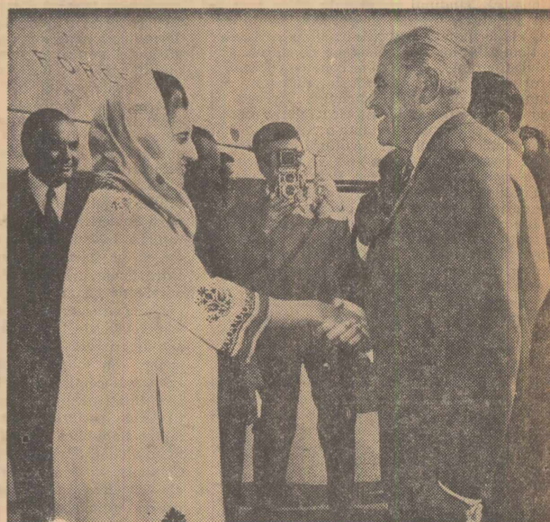
La sosire, pe aeroportul Băneasa

Din partea indiană au participat Rajeshwar Dayal, secretar pentru