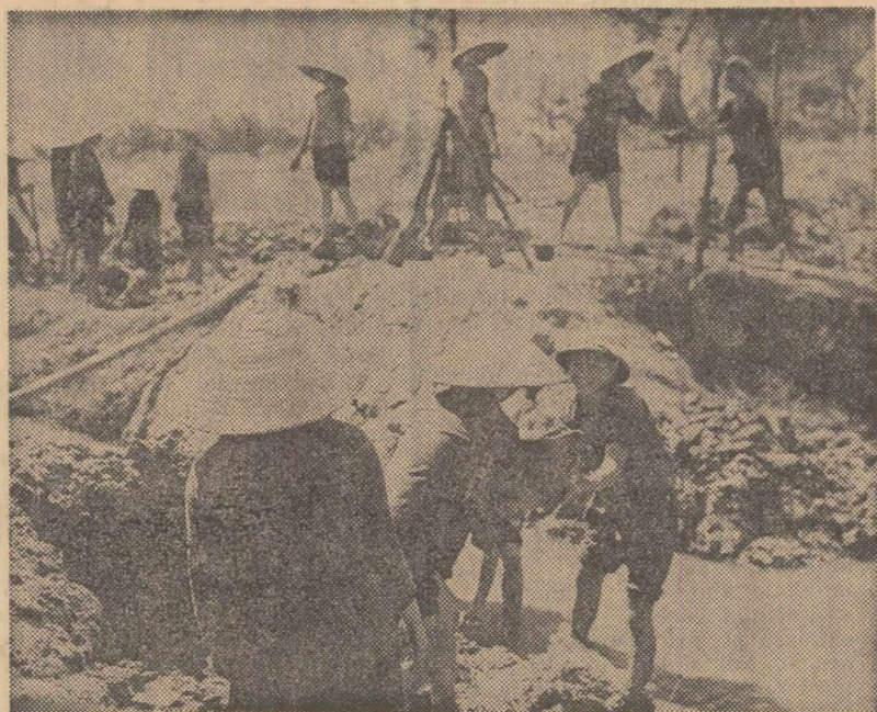
R. D. Vietnam. Dind dovadă de eroism și abnegație patriotică, țărani vietnamezi repară stricăciunile provocate digurilor și sistemelor de irigații de pe urma bombardamentelor americane. În fotografie: refacerea digului de lângă satul Haulok