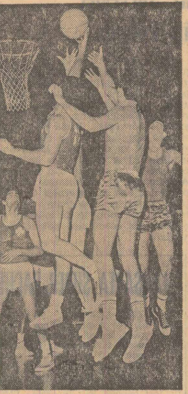
Va fi „coș”?

Cei mai buni realizatori ai gazdelor au fost Nostevici (25 de puncte) și Novacek (15); principalii realizatori ai oaspeților, Kolokitas (cospetral campionatul trecut al Greciei), a înscris 27 de puncte.