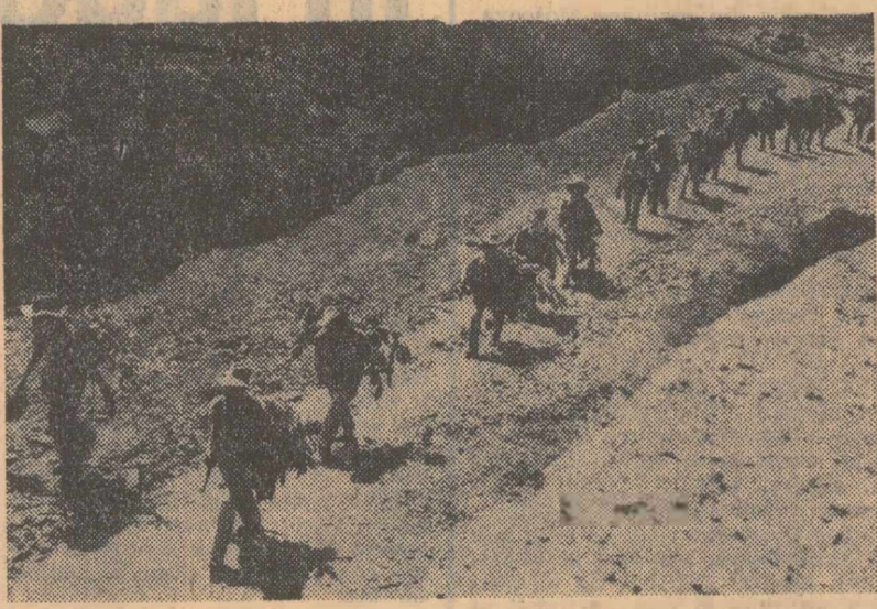
Un grup de patrioți din Vietnamul de sud în drum spre noi poziții de luptă

În ce privește problema nedesemnării, ea va fi examinată după ce Comitetul celor 18 de la Geneva își va prezenta concluziile sale prin raportul pe care îl va înainta Comitetului politic, care să servească drept bază de discuții. Încă de pe acum coordonatele pozițiilor diferitelor state membre au fost precizate. Fornind în general de la postulatul că securitatea internațională rezidă nu în înarmare ci în reducerea armamentelor, pină la faza ultimă a dezarmării generale, și manifestându-și în acest context aderența față de ideea nedesemnării, numeroși vorbitori la dezbaterile generale au arătat totodată că un instrument juridic poate fi util în acest sens numai prin neadmiterea unor privilegii și optium cu caracter exclusivist.