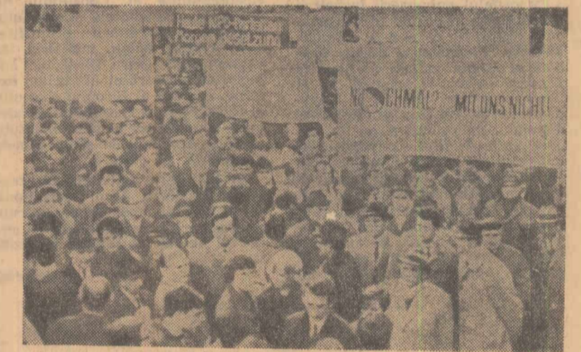
Deschiderea, la Hanovra, a lucrărilor Congresului Partidului Național-Democrat de extremă dreapta a stîrnit protestul opiniei publice din localitate. Vineri, pe străzile orașului, a avut loc o mare demonstrație, participanții cerînd interzicerea organizațiilor neonaziste

Comitetul pentru teritoriile neautonome și sub tutela al Adunării Generale a O.N.U. a votat cu o majoritate covârșitoare în favoarea unui proiect de rezoluție prezentat de peste 50 coautori, care condamnă Portugalia pentru politica sa colonialistă și cere tuturor statelor să ajute populația teritoriilor coloniale portugheze să-și dobîndească independența. Rezoluția cere, de asemenea, tuturor statelor și în primul rînd aliaților din N.A.T.O. ai Portugaliei să se abțină de la orice formă de ajutor militar acordat Portugaliei, inclusiv vânzarea de arme și echipament militar sau instruirea de soldați în cadrul sau în afara cadrului organizației N.A.T.O.