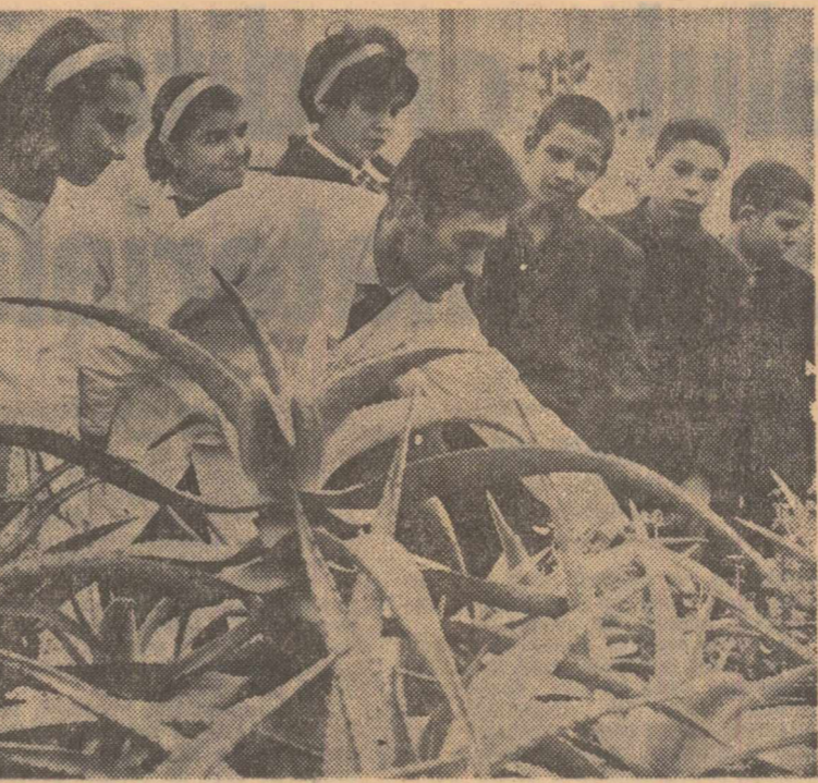
Elevi în vizită la grădina botanică a Universității A. I. Cuza din Iași.

șiei canto popular din cadrul școlilor de muzică fiind insu-ficient în raport cu cerin-țele formațiilor folclorice, no-menclatura elaborate de C.S.C.A. nu prevăd studii de specialitate pentru această categorie de artiști profesio-niști. Aceasta însă presupune din partea conducătorilor ar-tistici și a dirijorilor orche-strilor populare foarte multă exigență și discernămint în selecționarea și promovarea tinerelor talente, viitori inter-preti profesioniști ai cîntecu-lui popular.