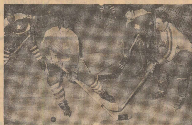
Atac românesc la poarta elvețiană