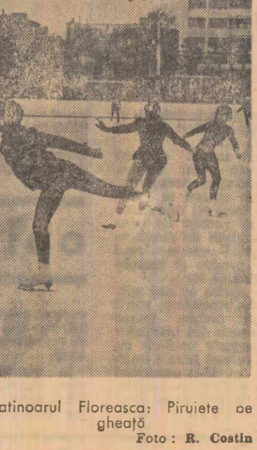
Patinoarul Floresca: Piruetea oa ghealcă.