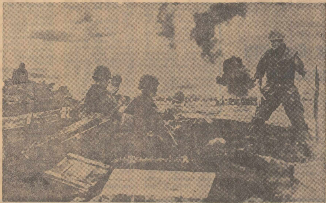
„URMATOAREA EXPLOZIE NE ESTE DESTINATĂ NOUA”. D. D. Duncan, fotoreporter devenit celebru în timpul războiului din Corea, a surprins pe peliculă scena din coșmarul trăit de trupele americane pe teritoriul Vietnamului de sud.