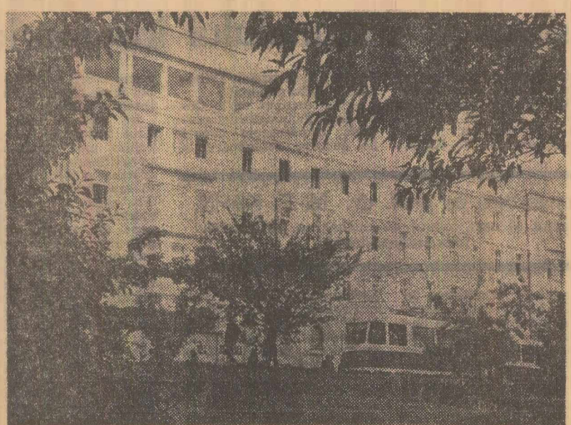
Noua aripă a hotelului „Bulevard” din Sibiu

În cartierele noi, sau în cadrul unor clădiri și ansambluri recent ridicate sînt locuri și planuri larg deschise vederii, pe care nu trebuie să le lăsam uniforme, monotone. Ele oferă și prin semnifica-tivă lor nouă, de avînt constructiv, în-tr-un cadru de echitate socială, de bunăstare și progres, un prilej de evolu- cere a eroilor clasei muncitoare, care s-au jertfit pentru acest prezent fericit. În cartierele Nicolae, Școala, Cantemir au avut rădăcini temeinice tradițiile de