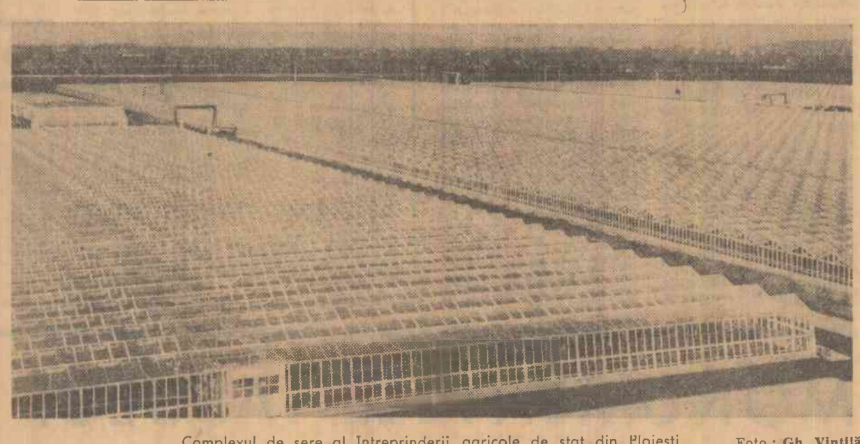
Complexul de sere al întreprinderii agricole de stat din Ploiești.

Se prevede, de asemenea, racordarea la noua conducță a unui combinat avicol, precum și a secției de pigmenti anorganici a Uzinei de lacuri și vopsele „Transilvania” aflată în curs de construcție.