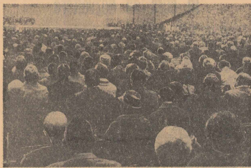
Adunarea de protest împotriva legilor excepționale, organizată de sindicatul vest-german al muncitorilor din industria metalurgică

Regele Constantin a fost victima politicii arbitrare și antidemocratice pe care o inaugurasă în primăvara anului 1965, când a deștitut guvernul ales al lui George Papandreu”, scrie editorialistul cotidianului cipriot grec „Teletex Ora”. Cotidianul critică pe rege pentru că a semnat toate legile junții de la Atena și a acceptat demisia a sute de ofițeri din armata greacă, ceea ce a permis „regimului dictatorial să se întărească”. Deși dictatura a câștigat ca de-a doua bătaie, conchide ziarul, ea a pierdut în același timp ceea ce mai mare parte a populației sale, căci „toți grecii, de la regaliști la comunisti, s-au îndepărtat de ea”.