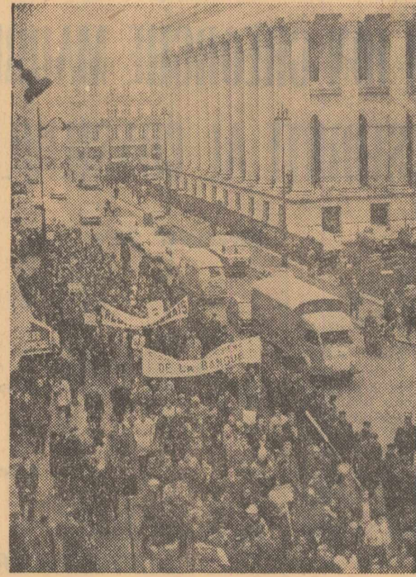
Numeroase greve, mitinguri și manifestații au marcat recent ziua de acțiuni revendicative ale oame-nilor muncii din Franța. În fotografie — o coloană de manifestații la Paris.

Într-un alt articol publicat de același săptămînal, se arată că pactul N.A.T.O. a adus mai multe prejudicii Turciei decît folose. A venit timpul să curățăm teritoriul țării de bazele și instalațiile acestui bloc — conchide revista.