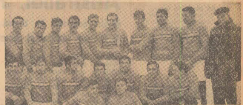
Duminică s-a încheiat campionatul republican de rugbi pe 1967. Titlul a revenit, pentru a zecea oară, formației „Grivița roșie”, antrenată de maestrul emerit Viorel Moraru. În fotografie: lotul echipei campioane, după meciul de ieri cu Agronomia Cluj. (Lipsește Demian și Irimescu, care n-au jucat în această partidă)