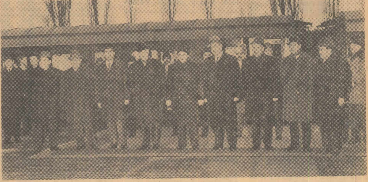
La sosire, în gara Băneasa

Duminică dimineața s-a înnoptat în Capitală, venind de la Moscova, delegația de partid și guvernamentală a Republicii Socialiste România, care, la invitația C.C. al P.C.U.S. și a Consiliului de Miniștri al U.R.S.S., a făcut o vizită oficială de prietenie în Uniunea Sovietică.