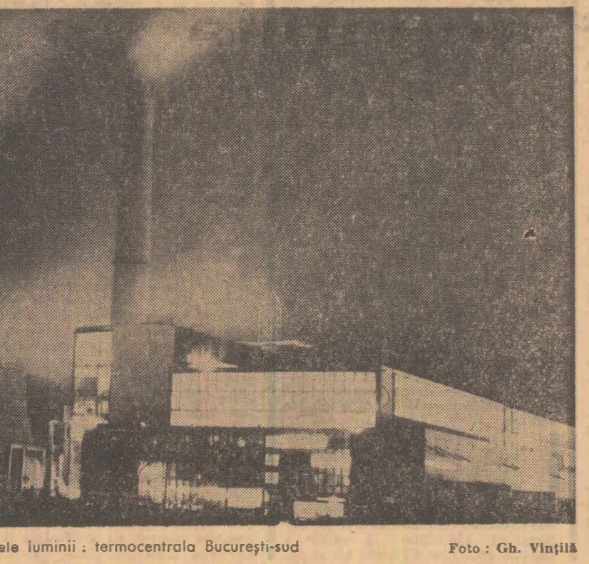
Unul din izvoarele luminii: termocentrala București-sud