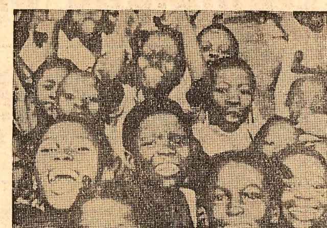
Republica Africa Centrală. Acești copii din Ouanda Djalo au cântat „vestea cea mare” — vor merge la școală nu organizată, expresie a unui program mai larg de școlarizare pentru care statul a alocat 19,9 la sută din buget

Prima mașină de calcul automată construită în Cehoslovacia — „M.S.P.-2-A”, a intrat în funcțiune. Mașina poate executa peste 7000 de operațiuni pe secundă. Cu ajutorul ei vor fi rezolvate unele sarcini în domeniul cercetărilor științifice și vor fi calculate programele optime de producție ale întreprinderilor agricole.