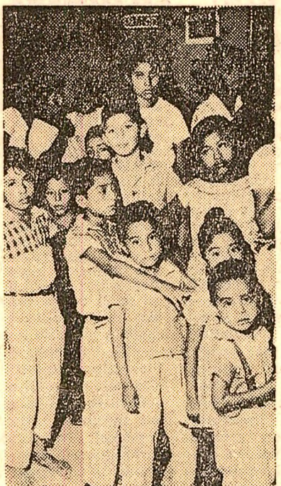
La un centru sanitar din Pochutla (Mexic), elevi așteptînd să treacă la controlul medical

Lucrările conferinței continuă în comitate și grupuri de lucru.