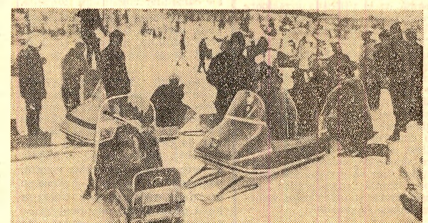
Canada. O expediție de explorare în nordul lacului Ontario, unde specialiștii apreciază că ar putea fi descoperite zăcăminte de uraniu și alte minerale rare

NEW YORK 22 (Agerpres). — Ministrul de finanțe al Statelor Unite, Henry Fowler, a chemat țările Europei occidentale să sprijine programul de redresare a balanței de plăți americane. „Țările Europei continentale, și în special țările membre ale Pieței comune, au surplusuri cronice ale balanței de plăți, care formează principala contrapondere a deficitelor americane”, a declarat Fowler. „De aceea, cea mai mare parte a poverii ajustărilor care rezultă din programul american trebuie să fie suportată de aceste țări”.