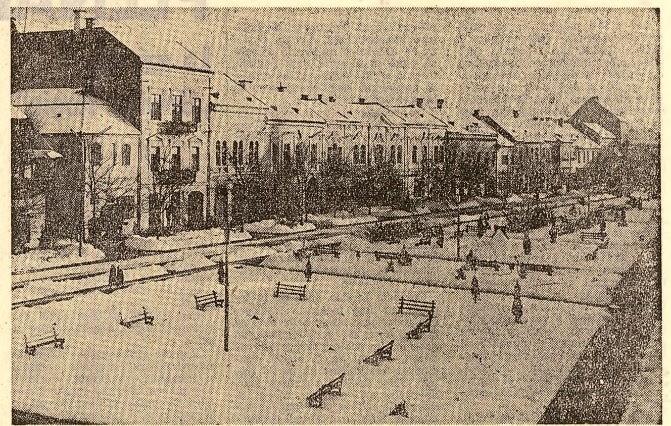
Centrul orașului Tg. Secuiesc, județul Covasna