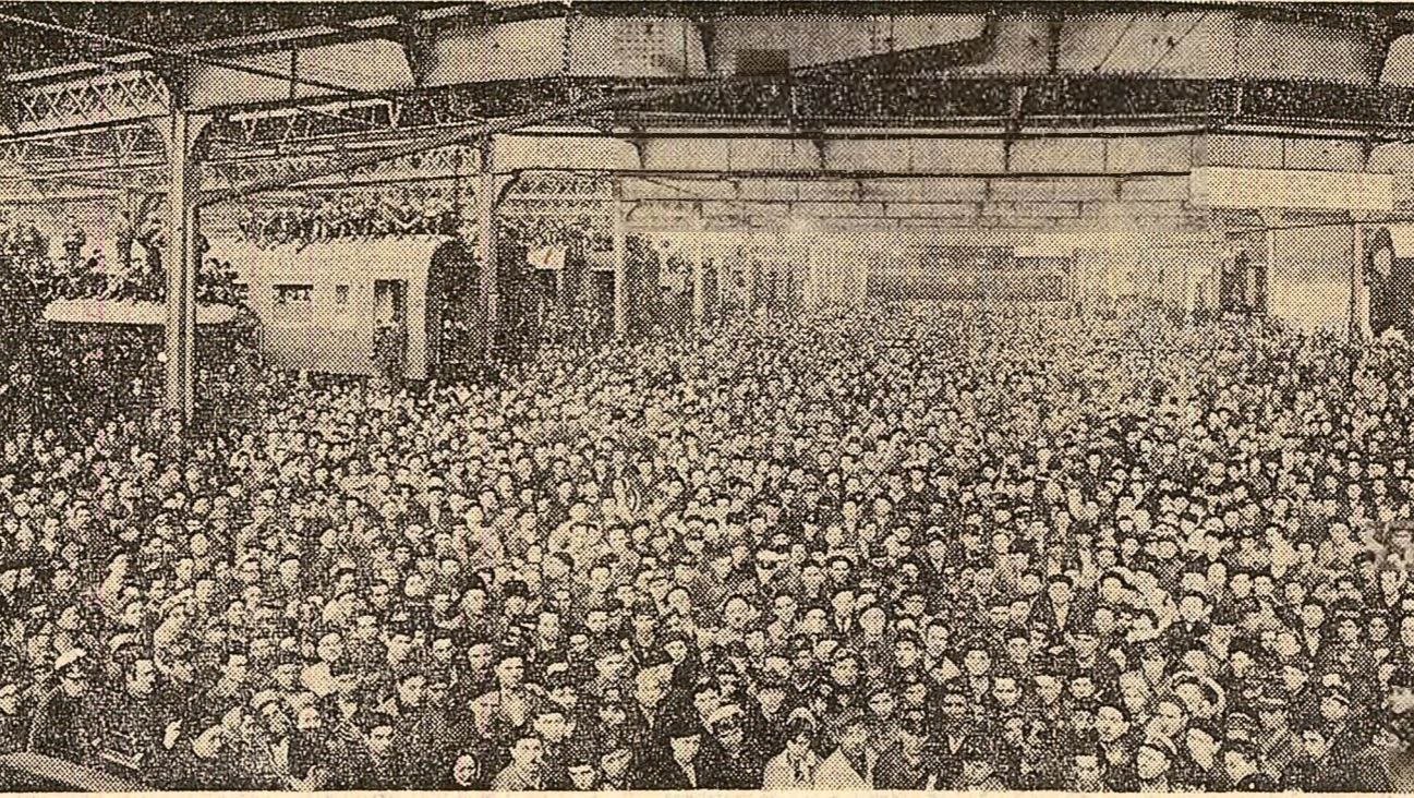
La uzinele „Grivița Roșie” din Capitală

tie și 5 aprilie 1968, în viața guvernului finlandez, transmisă cu prilejul vizitei în țara noastră a ministrului afacerilor externe al Finlandei, Ahti Karjalainen.