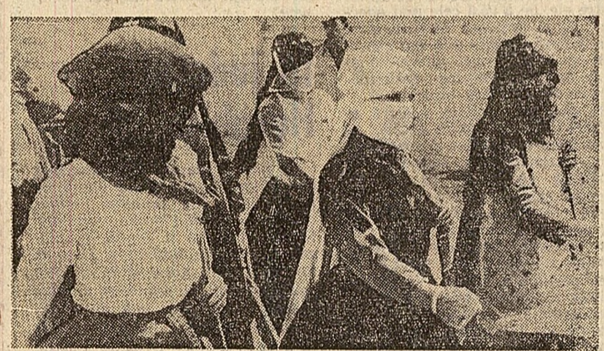
Printre cetățenii R. A. Yemen care au răspuns chemării guvernului de a se ridica în apărarea regimului republican se găsesc și numeroase femei. În fotografie: un grup de femei din Sonaa în timpul instrucției militare

Zăpada contaminată în urma prăbușirii la 22 ianuarie a unui bombardier „B-52” în Groenlanda va fi transportată în Statele Unite în cursul verii în recipiente blindate și îngropată, a anunțat Ministerul Apărării al S.U.A. După cum se știe, în urma accidentului s-a constatat că zăpada a devenit ușor radioactivă în zona prăbușirii avionului care avea la bord bombe cu hidrogen.