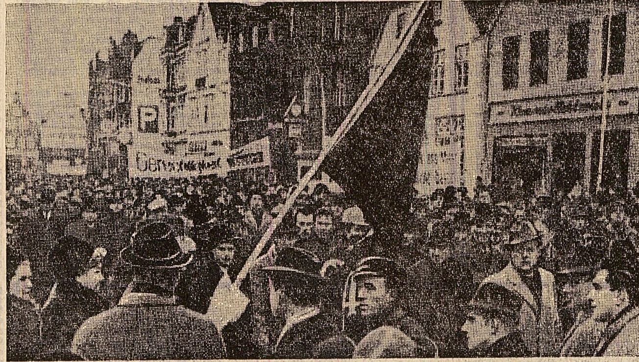
Fotografia redă un aspect de la demonstrația țăranilor din localitatea Husum, landul Schleswig — Holstein